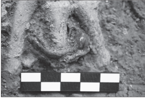
Sl. 1. Prsten PN 8 in situ

Fig. 1 Ring SF 8 in situ