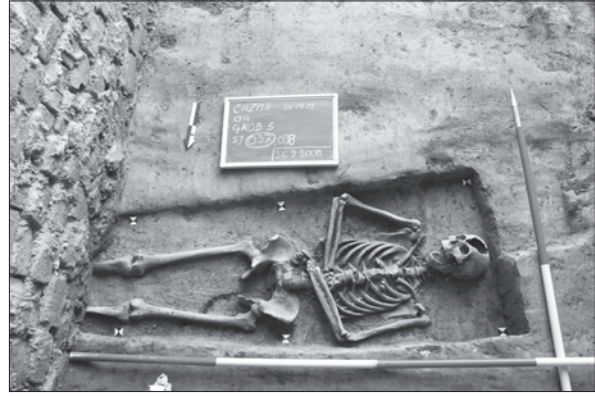
Sl. 2. Grob 5

Fig. 1 Ring SF 8 in situ