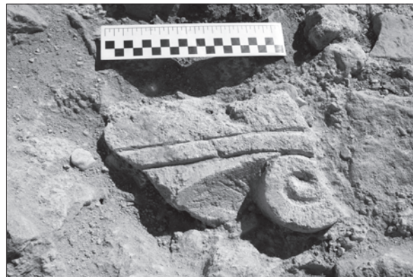
Sl. 2. Ulomak romaničkog kapitela Fig. 2 Fragment of a Romanesque capital

Od drugih stratigrafskih jedinica u SJ 1000 valja istaknuti dugi i uski otisak, možda od grede, koji se pružao u smjeru sjever-jug u dužini od oko 300 cm. U prosjeku je bio širok 8 cm, a dubok blizu 5 cm. Pružao se od južnog zida broda (SJ 186) do približno sredine broda, gdje se na njega pod pravim kutom, prema istoku, nadovezivao širinom i dubinom sličan otisak dug oko 50 cm. U SJ 1000 i 1001 bile su ukopane i tri rupe, možda za stupove, od kojih je jedna ustanovljena uza zapadni, a dvije blizu sjevernog zida broda. Bile su zapunjene masnijom tamnosmeđom zemljom s primjesama žbuke, a jednu od njih (SJ