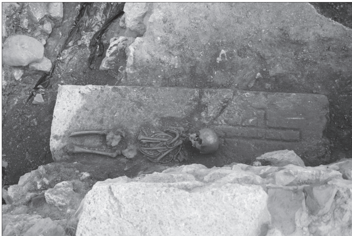
Sl. 3. Kamena ploča s plitko uklesanim križem Fig. 3 A stone plate with a shallowly engraved cross

pruža u smjeru sjever-jug; u južnom dijelu je građen oblutcima, a u sjevernome opekom. Sjeverno, uz popločenje od oblutaka, ustanovljena je stuba ili popločenje od razmrvene opeke, smještena uza stepenice uza sjevernu kulu. Ispod ovih SJ ustanovljeno je nekoliko slojeva rahle zemlje s vrlo mnogo primjesa žbuke i komada građevinskog materijala (opeka i kamenja), ispod koje se nalazio sloj žute gline (SJ 947) izrazito sličan sloju SJ 116, ustanovljenom u crkvenom brodu. Ovaj je sloj ležao na sloju pepela i ugljena s puno primjesa spaljenih kostiju (SJ 1061). Dijelom ispod sloja žute gline, a dijelom ispod sloja pepela i ugljena, ustanovljen je duž cijeloga ovog sektora svojevrsni kanal, zapunjen rahlom sivkastom zemljom, s puno primjesa bijele razmrvene žbuke i dosta velikoga kamenja. Nakon što su dokumentirani i zapuna i ukop ovoga kanala, na tom je području istraženo i šest mladih grobova: 177, 182, 184, 186, 187 i 193. Vjerojatno je najzanimljiviji grob djeteta 177 koji je bio ukopan iznad kamene ploče (sl. 3.) s plitko uklesanim križem (SJ 1222/PN-423). Kamen je otprilike po sredini djelomično oštećen, a uzrok tomu bi mogao biti upravo iskop za spomenuti grob. Čini se da se pri kopanju odustalo od pokušaja razbijanja kamene ploče te je pokojnik na kraju položen na ovaj kamen.