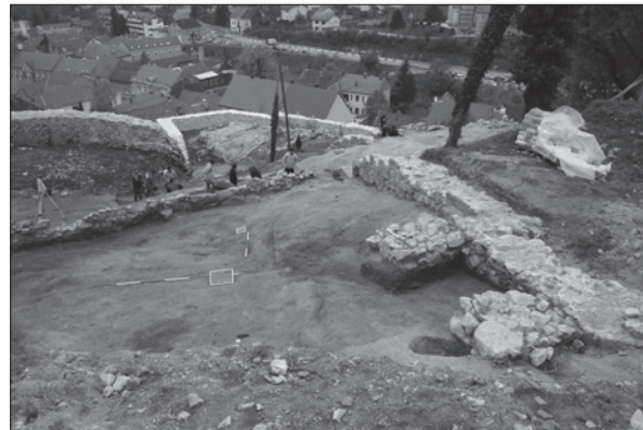
Sl. 4. Krapina-Stari grad, zid SJ 006 kojemu je na sjeveru dograđen SJ 024 i dva ulazna potpornja SJ 22 i SJ 23, pogled sa sjevera

Fig. 3 Krapina-Stari grad, view of the eastern façade of the wall SU 006 post-boles in SU 040