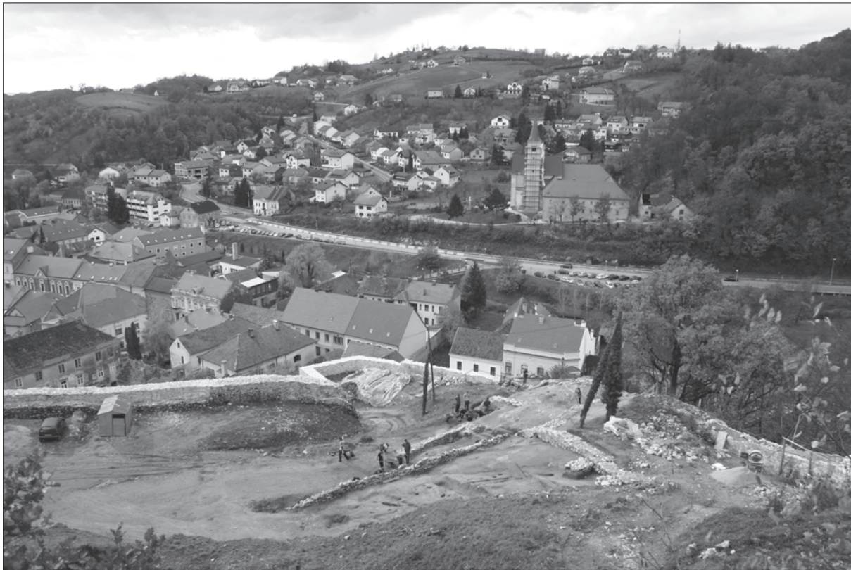
Sl. 1. Krapina pogled sa Staroga grada na brdo Šabac (lijevo) i franjevački samostan podno Josipovca (desno) te na arheološki iskop 2008. g. (foto: T. Tkalčec)