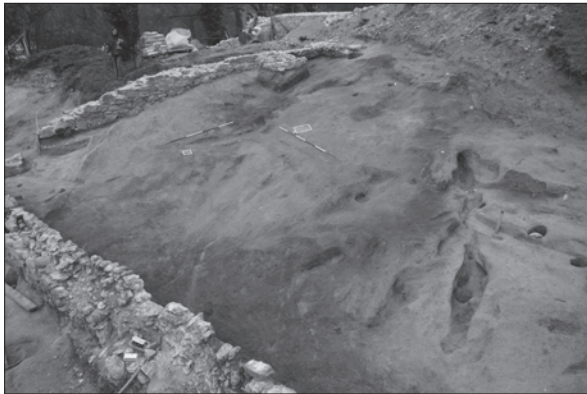
Sl. 3. Krapina-Stari grad, pogled na istočno lice zida SJ 006 i na ukope greda i stupova u SJ 040

Fig. 3 Krapina-Stari grad, view of the eastern façade of the wall SU 006 post-boles in SU 040