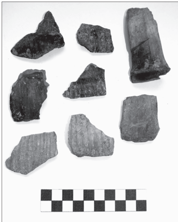
Sl. 3. Sotin-Srednje polje, sjeverni dio, ulomci daljske keramike