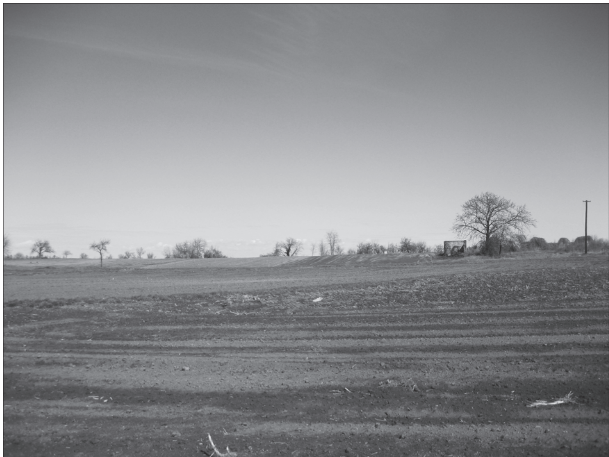
Sl. 2. Sotin – Srednje polje, pogled prema sjevernom dijelu gdje se nalazi eneolitičko i željeznodobno naselje

1 Sotin-Fancage; 2 Sotin-Gradina; 3 Sotin-castellum; 4 Sotin-Vrućak; 5 Sotin-east of school; 6 Sotin-Srednje polje; 7 Sotin-Vašarište