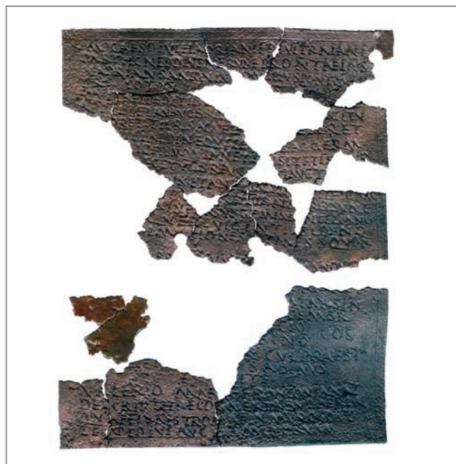
Sl. 3 Prva pločica, izvana Abb. 3 Erstes Täfelchen, Außenseite

DI[...] HONEST MI[...]QVOR NOM SVB SC[...]NT CI[...]T ROM QVI EORVM NON 15 HAB[...] DEDIT ET CON CV[...] VX QVAS TVNC HAB CVM [...]IVIT IS DA[...] AVT CVM IS QVAS P[...] DVX[...] DVMT[...]INGVLIS