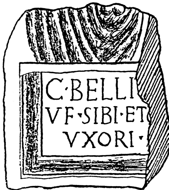
Slika 3 Fragment ugradbenoga nadgrobna reljefa iz Salone (po F. Bulić 1902)

reljef. Pri tome je zasigurno pred očima imao spomenike koji su stajali na salonitanskim nekropolama i koje je samo preslikao u drugi materijal. Da je takvih spomenika doista i bilo na salonitanskim nekropolama, istina sigurno ne u velikom broju, potvrđuje fragment reljefa koji je 1916. objavio Frane Bulić i interpretirao ga kao fragment portretne stele (sl. 3). 14 Iz natpisa saznajemo da je reljef prikazivao supružnike, a nije nemoguće da je bio prikazan i još neki član njihove obitelji. Danas s velikom sigurnošću možemo pretpostaviti da nije riječ o portretnoj steli već o jednom drugom, na istočnoj jadranskoj obali relativno rijetkom tipu nadgrobna spomenika - reljefu koji se kao slika ugrađivao u nadgrobnu građevinu, tj. mauzolej. Distinkciju takvih reljefa od nadgrobničkih stela moguće je izvršiti upravo preko za stele atipične poprečne koncepcije natpisa, nekada