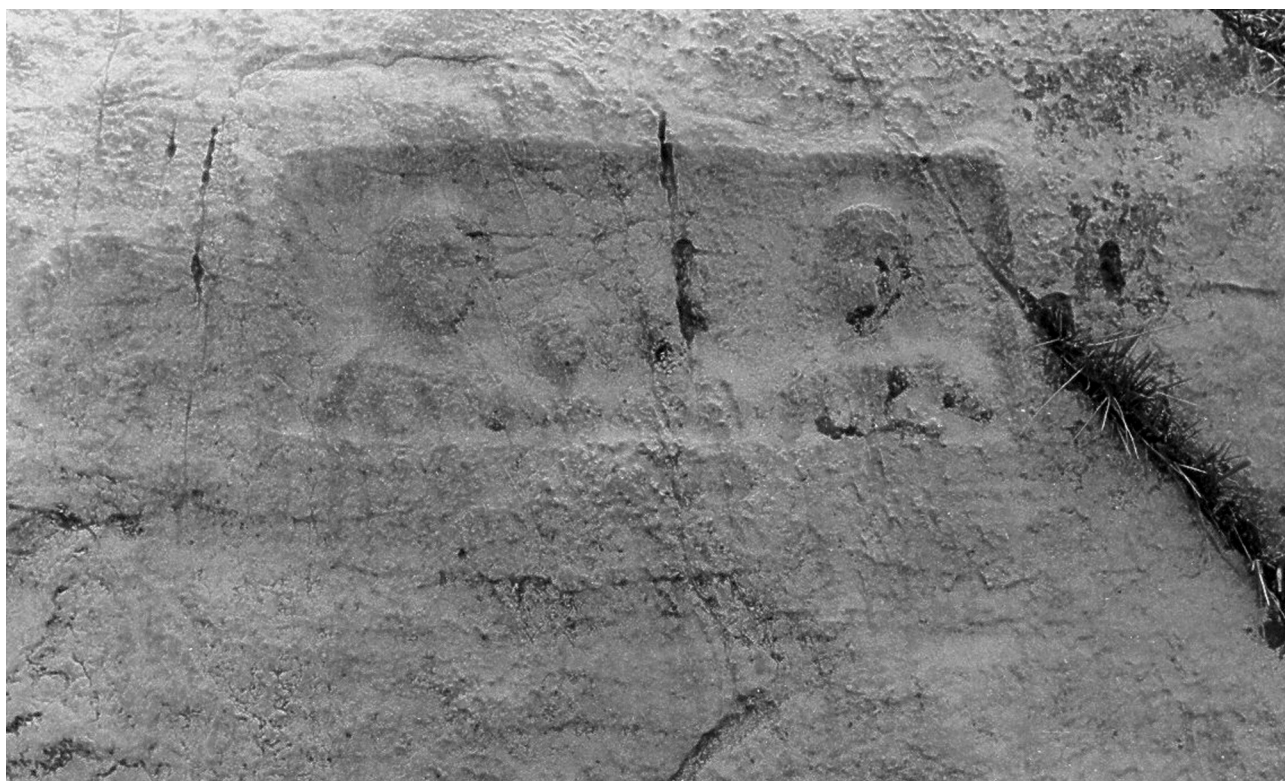
Slika 2 Nadgrobni reljef s prikazom četveročlane obitelji