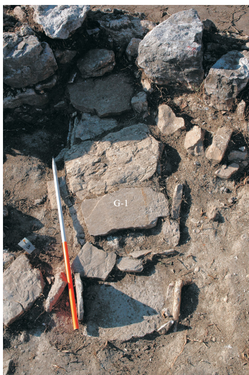
Slika 11 Grob 1 u tjemenu apside