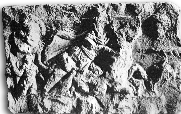
Slika 5 Reljef s prikazom Mitre

ikonografske inačice u prikazima Mitre i sv. Ilije: tako u Mitrinu kultu, nakon tauroktonije kojom Mitra postaje spasitelj ( soter ) ljudskoga roda, on i Sol priređuju gozbu nakon koje se obojica penju Solovim kolima na nebo, što je ikonografski identično načinu prikazivanja sv. Ilije. 15 U slučaju Crikvina to je zanimljiva slučajnost koju valja spomenuti. Za sad je nemoguće potvrditi točno mjesto svetišta, ali može se pretpostaviti da je kultni prostor bio u jednom od objekata villae rusticae , prenamijenjenom za kongregacijsku funkciju. Još nisu pronađeni dokazi o trajanju, o nasilnom prekidu ili pak mirnom napuštanju dotičnoga objekta koji bi po načelu svojevrsnoga kontinuiteta sakralne funkcije imanentne ovom prostoru, naslijedila kršćanska zajednica.