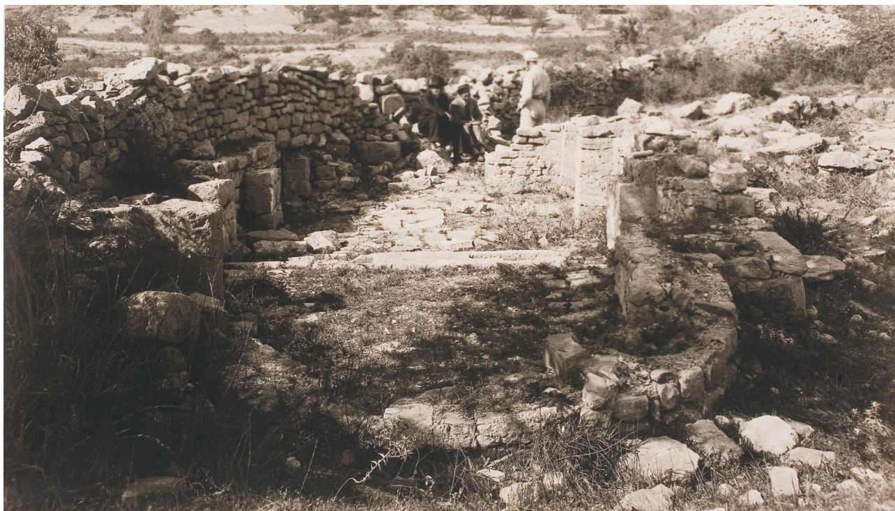
Slika 8 Dyggve, Karaman i Katić prije istraživanja godine 1929.