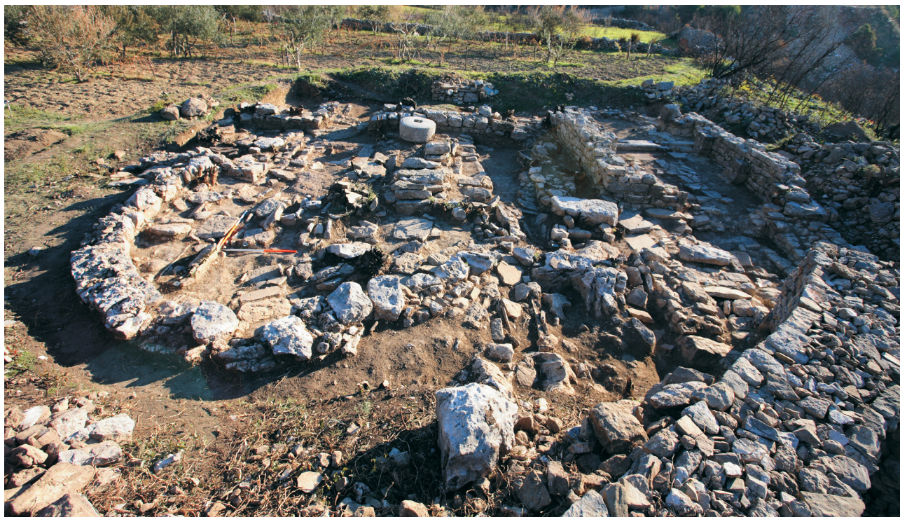
Slika 10 Pogled na istraženi kompleks sa zapada