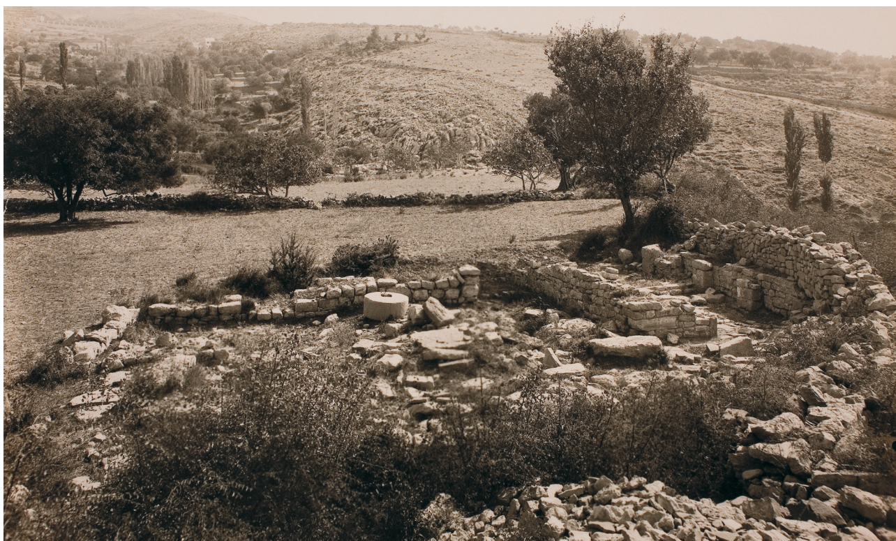
Slika 7 Pogled sa zapada na lokalitet prije Dyggveovih istraživanja