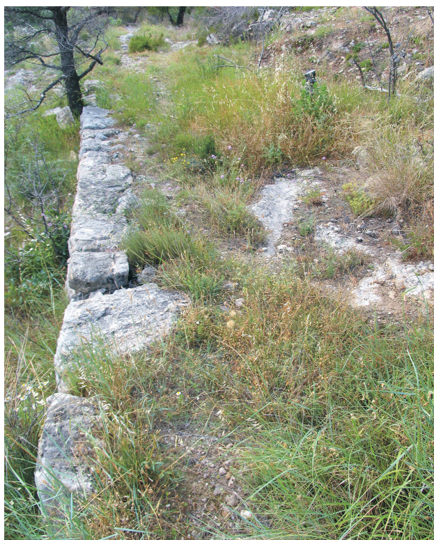
Slika 4 Dio trase antičkoga i srednjovjekovnoga puta u blizini Crikvina

crkva i benediktinski samostan u Rižinicama, nastali na antičkom gospodarskom sklopu samo nekoliko stotina metara južnije od Crikvina. 13