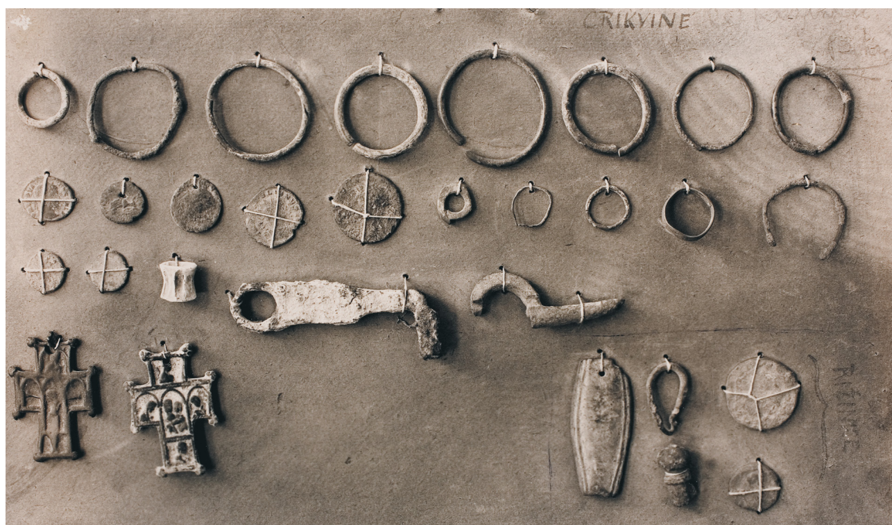
Slika 9 Grobnji prilozi nađeni u Crikvinama i Rižinicama