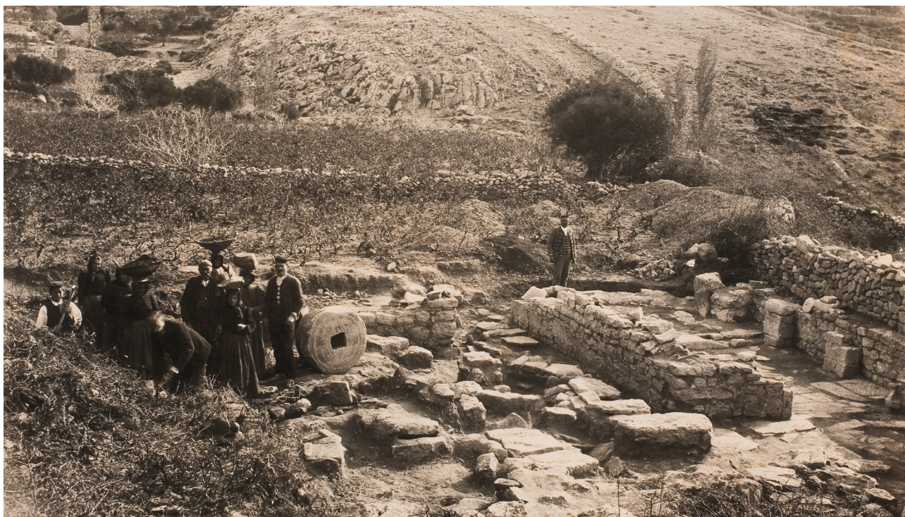
Slika 6 Fotografija lokaliteta s istraživanja don Frane Bulića godine 1908.