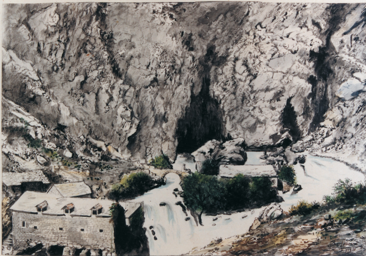
Ursprung der Salona (Bistrizza.)

podizanje mlinica i stupâ. Arhivski dokumenti spominju solinske mlinice već od srednjega vijeka, a prikazane su na raznim grafikama i kartama. 20 Stare srušene mlinice blizu izvora i nešto niže označene su već na karti Solina iz 1671. 21 i na Calergijevoj karti iz 1675. 22