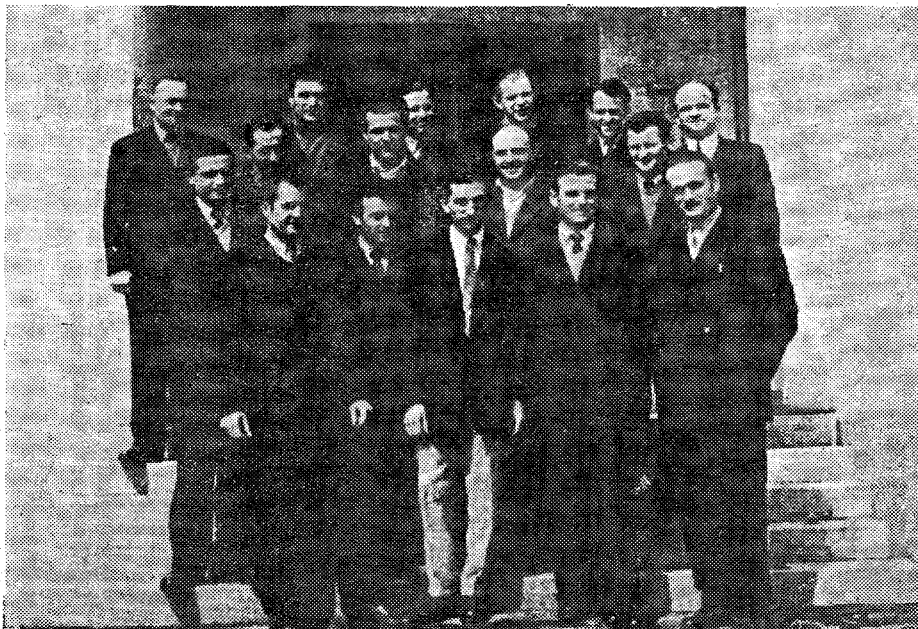
Kvalificirani radnici, koji su od 15—21. IV. 1955. s uspjehom položili ispit i stekli zvanje »mljekar«. Prethodno su pohađali 2-mjesečni pripremni tečaj u Osijeku od 20. II. do 15. IV. 1955.