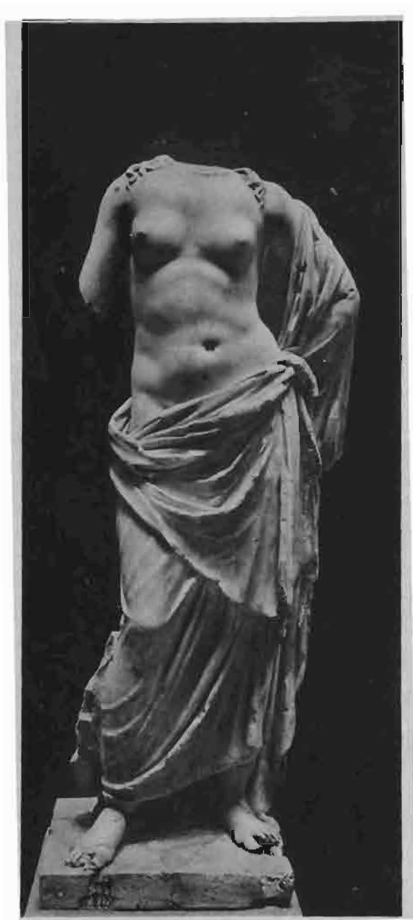
APHRODITA IZ MINTURNA U ITALIJI (NAR. MUZ. U ZAGREBU).