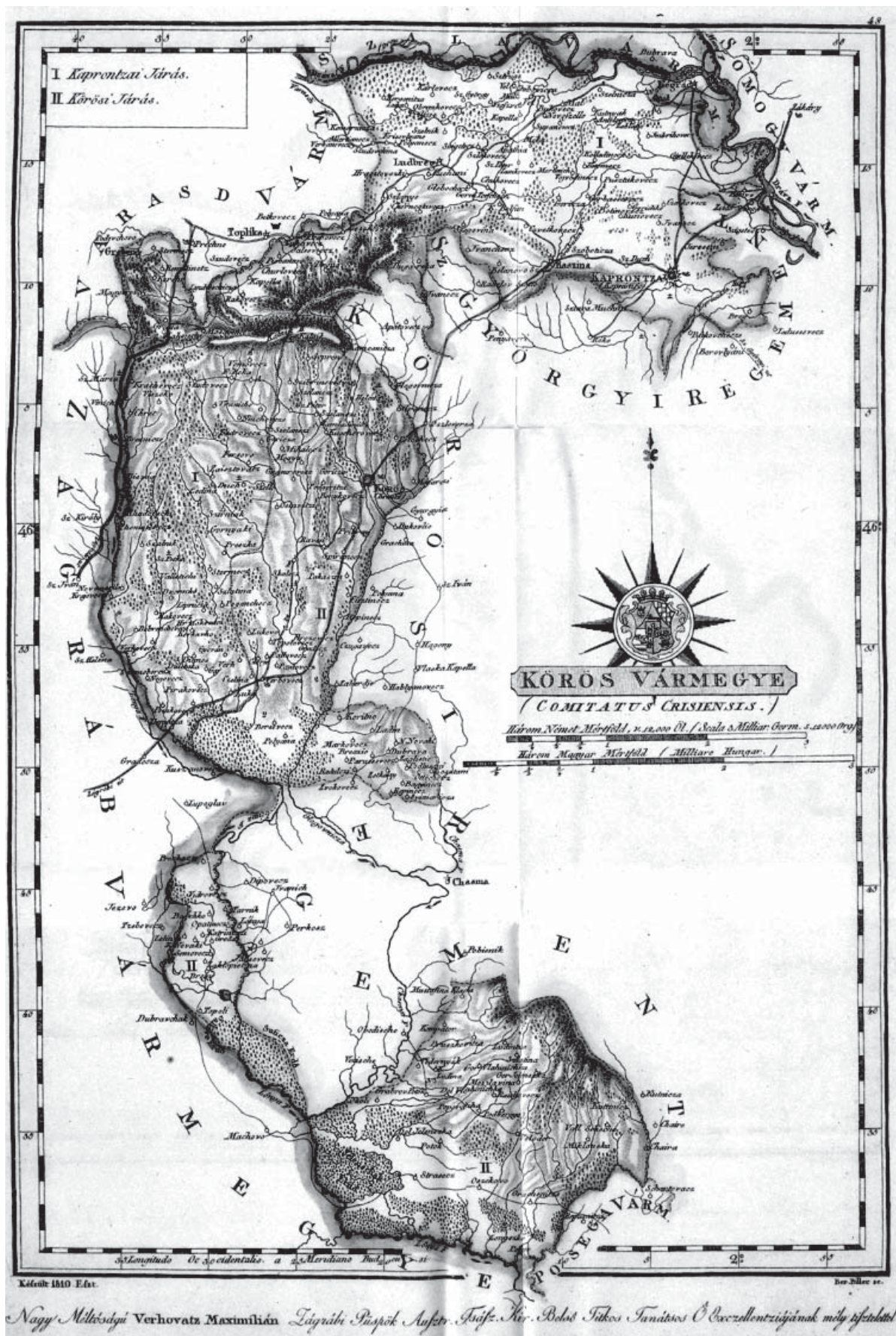
Sl. 1. Umreženost centralnog dijela Križevačke županije potocima na vojnoj karti iz kraja 18. stoljeća (Hrvatska na tajnim zemljovidima 18. i 19., stoljeća. Križevačka županija, Zagreb 2004).