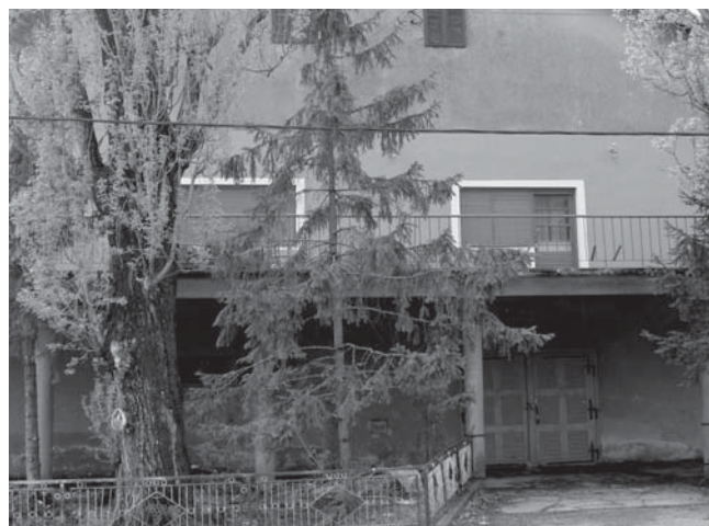
Današnji izgled zadruga