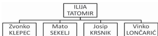
Shema 3. Ibeovska grupa “Dubrava”

Treća grupa ibeovaca djelovala je u općini Dubrava . Predvodili su je Ilija Tatomir i Zvonko Klepec, a pridružili su im se Mato Sekelj, 26 Vinko Lončarić i Josip Krsnik. U dokumentima su opisani kao “grupa nezadovoljnika.” 27 Njihova djelatnost sastojala se od slušanja ibeovskih radio-stanica i širenja panike među svojim susjedima. 28 Treća grupa ibeovaca ( dubravska ) bila je izrazito lokalnog karaktera te bez većih akcija i utjecaja izvan Dubrave. Iako nema egzaktnih podataka, pretpostavljamo da je s djelovanjem počela u zimu 1950., a razbijena je hapšenjem Tatomira i Klepeca, u siječnju 1951. godine. 29