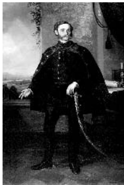
Slika 2. Ljudevit Farkaš Vukotinović

Vukotinović je tih dana jasno izražavao slavensku ideju hrvatskog pokreta te je u zajedništvu južnih Slavena vidio spas i za Hrvate jer se: - Talijani se kupe u jedno kolo, to isto rade i Nijemci, što bi iz nas bilo, kada bi mi mirno gledali (...) nijedan od ovih nije prijatelj Slavjanstva". Vukotinović onda nabroja zemlje gdje se čuje "naša riječ" , Banat, Bačka, Srbija, Slavonija, Bosna, Bugarska Hrvatska, Dalmacija, Crna Gora, Hercegovina, Kranjska, Koruška i Štajerska neskriveno