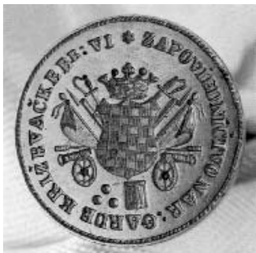
Slika 4. Pečatnjak zapovjedništva Narodne garde križevačke 91