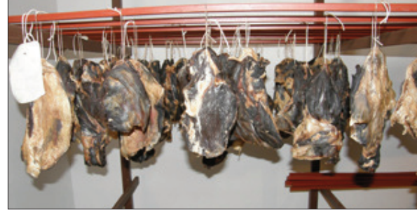
Slika 4. Otkošteni butovi u fazi zrenja Picture 4. Deboned haunches in drying-ripening phase

površine i mase, mikroklimatski uvjeti (temperatura, RH i brzina strujanja zraka) itd.