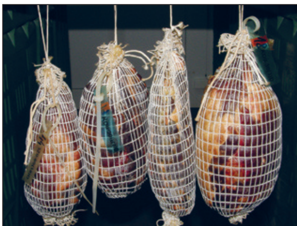
Slika 6. Sušena ovčetina (unutarnji dio buta ili "šoll") Picture 6. Dry-cured sheep meat (inner part of the haunch, the so-called "Scholl")