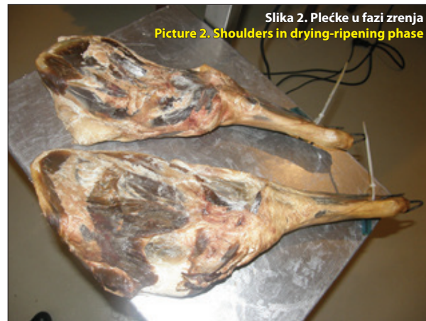
Slika 2. Plečke u fazi zrenja Picture 2. Shoulders in drying-ripening phase

uvjeti zrenja, način pakiranja gotovog proizvoda itd.