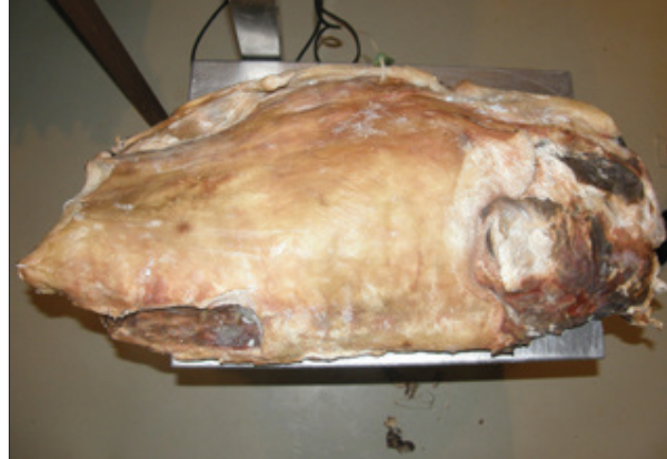
Slika 3. „Kora“ u fazi zrenja Picture 3. „Kora“ in drying-ripening phase

suđu redosljedom: butovi, lopatice i na kraju „kora“ medijalnom stranom okrenutom na gore. Nakon 4-5 dana može se obaviti okretanje komada mesa i odstranjivanje mesnog soka ukoliko se za to ukaže potreba. Iz salamure se najprije vade „kore“ i to nakon 6-7 dana, zatim lopatice nakon 7-10 dana i na kraju butovi nakon 10-13 dana. Vrijeme trajanja ove faze ovisi o masi pojedinih komada mesa, debljini mišićnog tkiva te količini površinskog loja. Nakon vađenja iz salamure meso se ispere hladnom vodom, ocijedi i stavi u prostoriju za dimljenje i sušenje.