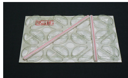
SLIKA 13. ClimaComfort ploča

Treća nagrada pripala je tvrtki Roth Werke GmbH za proizvod ClimaComfort-Systemplatte (slika 13). Ploča je napravljena od 100 %-tnog reciklata PET-a, a nalazi svoju primjenu kao dio ClimaComfort sustava. Sustav je namijenjen grijanju i hlađenju u građevinarstvu, pri modernizaciji starih i građenju novih zgrada. Može se ugraditi u već postojeće zidove, podove i stropove. Postupak izradbe ploče je duboko vučenje. Regenerat PET-a najprije se zagrijava, a zatim oblikuje podtlakom u aluminijskom alatu.