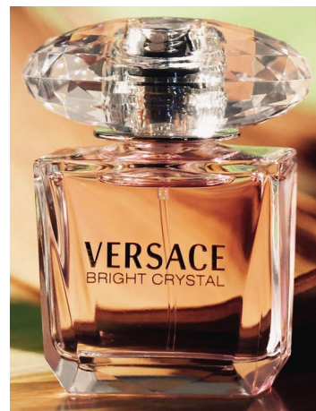
SLIKA 9. Délices de Cartier i Bright Crystal u luksuznoj ambalaži

Miris koji potpisuje slavni proizvođač satova i nakita upakiran je u izvrsno dizajniranu staklenu bočicu, obrađenu poput najfinije-ga nakita, a crvena boja sadržaja u kontrastu je s prozirnim čepom u obliku cvijeta. Upravo je kompliciran oblik cvijeta bio izazov jer je načinjen injekcijskim prešanjem, bez uleknuća, a latice su potpuno prozirne.