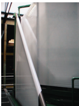
SLIKA 6. Traversanip™ izvlačilica tvrtke Battenfeld Gloucester

Osnovni dijelovi linije za proizvodnju silažnoga crijevnog filma uključuju sustav za ubrizgavanje PIB-a, pužni vijak za optimalno umješavanje PIB-a, alat, izvlačilicu i namotavalicu. Konstrukcija Traversanip™ izvlačilice (slika 6) sadržava posebne neljepljive zakretne šipke, keramikom prevučeni čelični povlačni valjak i poseban valjak od silikonskoga kaučuka. Svi se valjci hlade vodom, a nalaze se u S poretku.