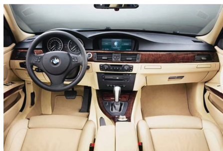
SLIKA 4. Unutrašnjost BMW-a

Nova vrsta materijala, trgovačkog naziva Nepol™ GB215HP , razvijena je namjenski, za izradbu gornjeg, srednjeg i donjeg dijela instrumentne ploče, a riječ je o polipropilenu ojačanom s 20 % dugih staklenih vlakana (slika 4).