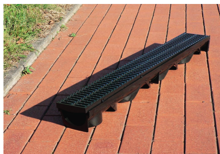
SLIKA 11. Odvodni žlijeb MPO Easy

Prva nagrada ide tvrtki Multiport Recycling GmbH za proizvod MPO Easy , odvodni žlijeb s plastičnom rešetkom koja je napravljena od mljevenih čepova boca za napitke (slika 11). Odvodni žlijeb ima malu masu (žlijeb s rešetkom teži 2,1 kg) uz istodobnu veliku nosivost (prema normi EN 1433 – klasa A15). Moguća je čvrsta veza između dva elementa žlijeba, a plastična rešetka pričvršćena je steznim spojem pa micanje i izvijanje rešetke nije moguće. Žlijeb se učvršćuje u beton, a glatka površina omogućuje optimalno samočišćenje. Odvodni žlijeb postojan je na sol za posipanje cesta te smrzavanje.