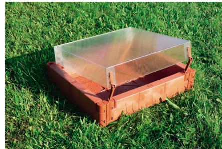
SLIKA 12. Gredica za balkone i terase

(slika 12). Gredica je napravljena od 100 %-tnog reciklata PE-HD-a od čepova za boce. Poklopac je načinjen od polikarbonata. Budući da je gredica toplinski izolirana, može služiti za priplod, odnosno bez poklopca kao minivrt za balkon ili terasu za povrće ili cvijeće u ljetnim mjesecima. Gredica može biti veličine 60 - 70 cm i visine 27 cm.