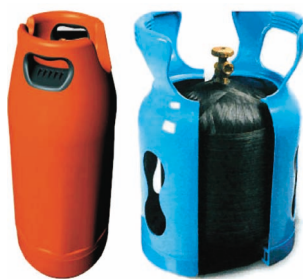
SLIKA 5. Nova konstrukcija boce za ukapljeni prirodni plin

Zahvaljujući inovaciji portugalske tvrtke Amtrol-Alfa , najvećega europskog proizvođača cilindara za skladištenje ukapljenoga prirodnog plina (LNG), rukovanje plinskim bocama koje se koriste za pripremu hrane na otvorenome bitno je olakšano. U suradnji sa švicarskom podružnicom tvrtke Dupont Polymer Powders i francuskom tvrtkom Saint-Gobain Vetrotex Int. , portugalska tvrtka tržištu je predstavila novu generaciju prenosivih boca za ukapljeni prirodni plin, izrađenih od kompozitnih materijala (slika 5). Nova boca lakša je od do sada uobičajeno korištenih za 50 % zbog primjene kompozitnih materijala.