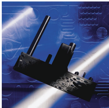
SLIKA 7. Temeljna ploča izmjenjivog spremnika za DNK/RNK analizu

gense od PP-a. Ostale elemente (filtrar, brtveni film i klipove za potiskivanje reagensa u spremniku) isporučila je tvrtka directif GmbH . Bez kapljevitoj sadržaja novi spremnik ima masu od samo 40 g. Temeljni razlog izbora polimernih materijala za izradbu izmjenjivog spremnika je ekonomičnost njihove izradbe injekcijskim prešanjem u milijunskim serijama.