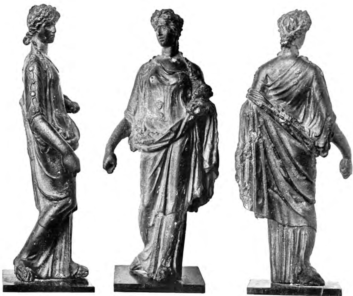
68. Fortuna. Bronsan kipić iz Vinkovaca.