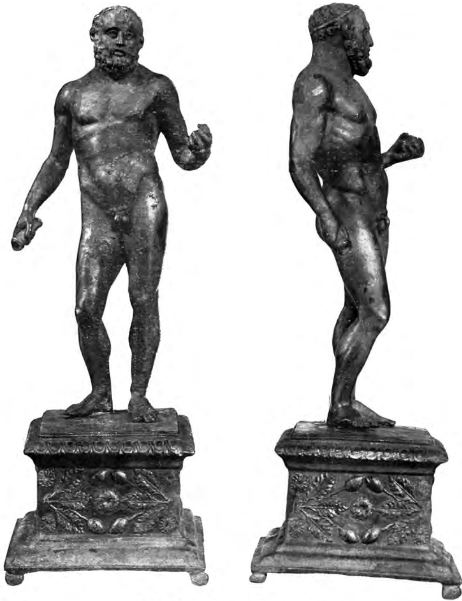
60. Herakles. Bronsan kipić iz Siska.