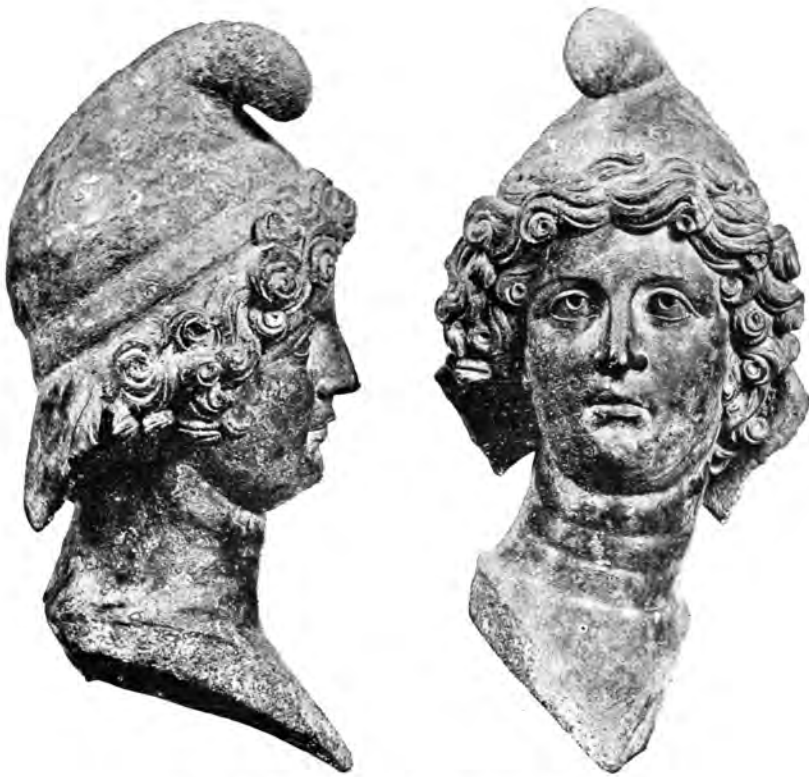
53. Mithras. Bronzana glava iz Siska.