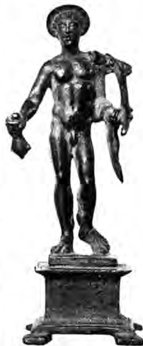
Figura je u mnogo koječem slična onoj pod br. 27. Tijelo joj je preveć plosnato izvedeno a isto vrijedi i za glavu, koja nema petaza, nego su joj krila iz-

Vis. 95 mm. Manjka komad d. ruke i kerykeion u l. ruci.