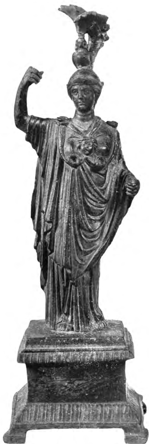
11. Athena. Bronsan kipić iz Grbavca u Hrvatskoj.