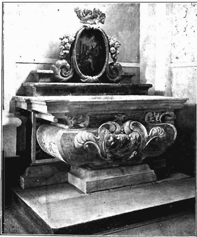
Sl. 118. Ostatak žrtvenika bivše kapele Bl. Dj. Marije Loretske u crkvi sv. Katarine u Zagrebu.

salizzato di lastre bianche e negre a sessangolo. Il scalino dell'altare di pietra rossa di Lubiana. La pradella di paragone con in mezzo una stella a raggi bianchi e rossi. La cimasa come pure la base del paliotto di bianco di Carara. Il paliotto medesimo dell'istesso bianco di Carara con in mezzo uno specchio d'Africano ben colorito circondato da cartelli a basso rilievo, e altri rimessi di giallo di Torre e rosso di Francia. I due fianchi posti in profilo di bianco di Carara con rimessi compagni a quelli del