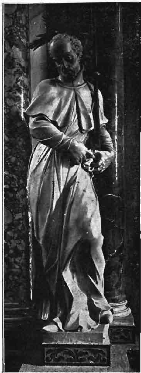
Sl. 115. Kip sv. Franje Regisa na žrtveniku sv. Ignacija u crkvi sv. Katarine u Zagrebu.

Crkva je svete Katarine otegnuta građevina, koja jako sjeća na najpoznatije barokne isusovačke hramove. Graditelju, koji je uredio unutrašnjost crkve, svakako su bile poznate rimske isusovačke crkve, napose // Gesù , djelo Vignolino. Različite prilike dakako nisu dozvoljavale, da se unutrašnjost crkve // Gesù naprosto kopira, ali u koliko se je to dalo, prenesena je ta crkva u sv. Katarinu. Uz glavnu lađu nalaze se lijevo i desno po tri kapele, duboke do 3½ metra. Prve dvije do svetišta široke su 4½ m, a za zadnju preostalo je 5 metara. Te su kapele otvorene cijelom širinom prema lađi, a gore polukružno svodeni otvori razmjerno su veoma visoki. Od luka pa do crkvenoga svoda bilo je još dosta prostora, koji je trebalo nekako ispuniti. Tu su se u štuku izradili bogato iskićeni grbovi darovatelja s napisima, a iznad svega toga bilo je još mjesta, da se načine željezne rešetke malih korova, koji se nalaze nad kapelema. Kako dubljina tih kapela nije velika, nisu se mogli načiniti prolazi iz jedne kapele u drugu, a prozori nisu dozvoljavali, da se oltari postave uz uzdužne stijene crkve. Zato su žrtvenici prislonjeni uz uske zidove, koji su bliži svetištu. Kapele su u glavnom uređene u godinama 1721.—1726., pa su sa svojim do vrha kapela sižućim žrtvenicima sve bile jednako urešene. Šteta je, da to danas više nije tako, jer je žrtvenik u zadnjoj kapeli desne strane maknut sa svojega mjesta. Sve su kapele bogato ure-