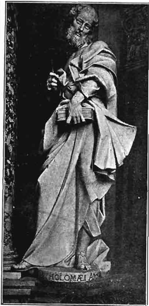
Sl. 124. Kip sv. Bartola apostola. Stajao na desnoj strani oltara sv. Barbare u prvostolnoj crkvi zagrebačkoj. Sada na oltaru sv. Martina u župnoj crkvi u Varaždinskim Toplicama.

Kako se već iz priloženih slika jasno razabire, oba su žrtvenika bila jednaka ne samo oblikom nego i izborom kamenoga materijala. Donji dio žrtvenika ima oblik sarkofaga, koji je barokan, ali sprijeda nije ispupčen, nego ravan. Pozadina je crni mramor s bijelim žilama, a na njoj je bogat ornamentat iz bijeloga kararsko-