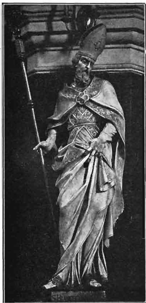
Sl. 122. Kip sv. Franje Saleškoga. Stajao na desnoj strani oltara sv. Katarine u prvostolnoj crkvi zagrebačkoj. Sada u župnoj crkvi u Sisku.

Sa žrtvenicima poslana su u Varaždinske Toplice sva tri kipa sa žrtvenika sv. Barbare, a od oltara sv. Katarine samo kip sv. Filipa Nerija. Kipovi sv. Andrije apostola i sv. Franje Saleškoga dospjeli su u Sisak. Ona četiri kipa, što su otpremljena u Varaždinske Toplice, smještena su sada ovako: Na oltaru sv. Barbare stoji desno kip sv. Stjepana prvomučenika, a lijevo sv. Filip Nerij, na oltaru sv. Katarine (sada sv. Martina) desno sv. Bartol apostol, a lijevo sv. Matija apostol.