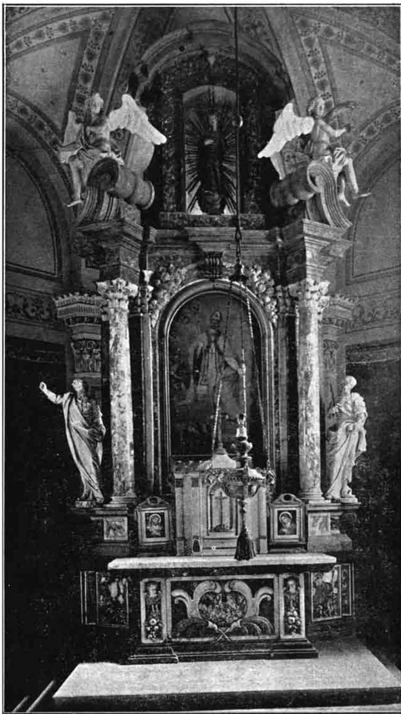
Sl. 120. Oltar sv. Katarine iz prvostolne crkve zagrebačke. Sada, posvećen sv. Martinu, u župnoj crkvi u Varaždinskim toplicama. Gornji dio oltara i oltarna slika izmijenjeni u novije vrijeme.