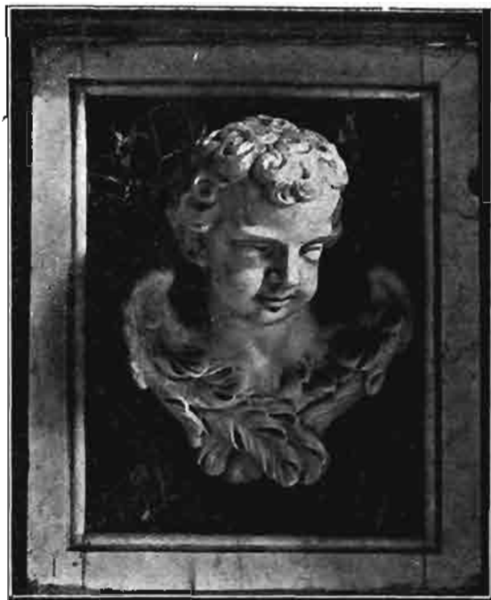
Sl. 131. Andeoska glavica na žrtveniku sv. Emerika iz prvostolne crkve zagrebačke. (Sada u župnoj crkvi sv. Ivana u Novoj vesi.)

Franjo Robba bio je čista umjetnička narav, pa zato i nije stekao nikakvoga imetka. Njegovi su umjetnički radovi slabo nosili, a kod nekih je i nadplaćivao. Uza sve to se on nije osvećivao lošijim radom, nego je svakom spomeniku posvećivao jednaku ljubav, nastojeći da potpuno zadovolji svoje poslodavce. Bila je za nas sreća, da je bio takav i da se nije uslijed premalene zasluge odlučio, da ostavi Ljubljanu i potraži drugdje bolju sreću. On je tako sav svoj rad posvetio nama, pa ga zato, premda je bio rođeni Talijan, možemo potpuno smatrati svojim i dati mu odlično mjesto među jugoslavenskim umjetnicima.