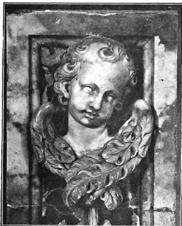
Sl. 128. Andeoska glavica s oltara sv. Barbare u prvostolnoj crkvi zagrebačkoj. Sada u župnoj crkvi u Varaždinskim Toplicama.

crkvi svete Katarine, radio je ujedno i donji dio te tabernakul za glavni oltar tadašnje isusovačke crkve sv. Jakova u Ljubljani. Taj ga je posao intenzivno pozabavio cijele četiri godine, a svršio ga je god. 1732. Iza toga radio je glavni oltar za tadašnju augustinsku, sada franjevačku crkvu, koji je posao započeo prije godine 1736., a svršio ga tek iza godine 1743. Već 1730. bio se je obvezao, da će u tamošnjoj uršulinskoj crkvi presv. Trojstva podići veliki žrtvenik za svotu od 5000 for. bez kipova. Na tom je žrtveniku radio sve do god. 1744., a troškovi su narasli na 11.136 forinti. Kada je taj posao svršio, bio je već potpisao ugovor za izgradnju zdenca pred gradskom kućom. Taj ga je posao tako zaokupio, da zdenac godine 1749. još uvijek nije bio gotov. Osim tih velikih djela izradio je Robba u to vrijeme i više manjih, a znade se, da