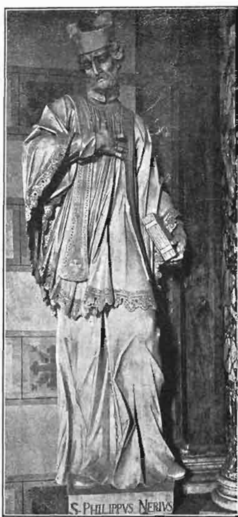
Sl. 123. Kip sv. Filipa Nerija. Stajao na lijevoj strani oltara sv. Katarine u prvostolnoj crkvi zagrebačkoj. Sada na žrtveniku sv. Barbare u župnoj crkvi u Varaždinskim Toplicama.