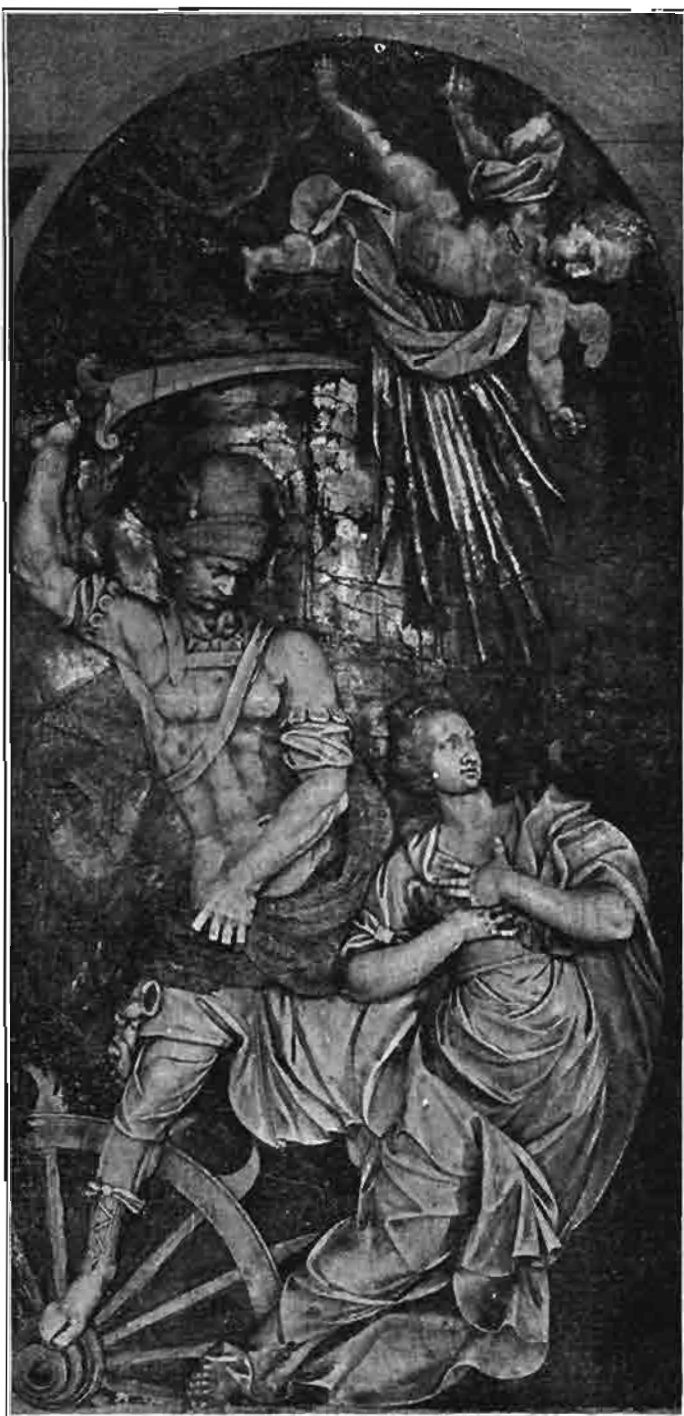
Sl. 121. Reljef s oltara sv. Katarine iz prvostolne crkve zagrebačke. Sada uzidan u lazi župne crkve u Varaždinskim Toplicama,

Kipovi, što ih je Robba postavio na ove žrtvenike, ne stoje niti izborom materijala niti izradbom na onoj visini, na kojoj stoje kipovi svetaca na oltaru sv. Ignacija. Može se to tumačiti tako, da je izradba ovih potonjih stajala pod kontrolom rektora ljubljanskoga isusovačkoga kolegija, koji je uopće imao da odredi, kako se ti sveci imaju izraditi. Uza sve to