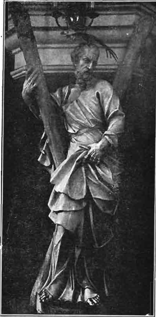
Sl. 127. Kip sv. Andrije apostola. Stajao u gornjem dijelu oltara sv. Katarine u prvostolnoj crkvi zagrebačkoj. Sada u župnoj crkvi u Sisku.

Ni bijeli uresi okolo okvira oltarne slike ne odaju njegove ruke; napose je gornji ornamentat s anđeoskim glavicama previše tvrdo izrađen. Pogotovo za cijeli gornji dio žrtvenika možemo reći, da ga nije uredio Robba. Oblaci s anđeoskim glavica-