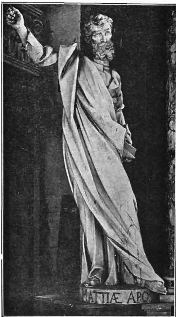
Sl. 126. Kip sv. Matije apostola. Stajao u gornjem dijelu oltara sv. Barbare u prvostolnoj crkvi zagrebačkoj. Sada na oltaru sv. Martina u župnoj crkvi u Varaždinskim Toplicama.

ga mramora, donekle sličan uresima na prije opisanim žrtvenicima. Uresni specchio unutar toga ornamenta načinjen je iz mramora mesnate boje. Gore i dole ima sarkofag vijenac iz crnoga kamena. Menza je žrtvenika znatno veća od sarkofaga, pa su joj krajevi lijevo i desno daleko van, stršili. Majstor ih je podupro četverouglatim stupovima. Iz kakvoga su materijala ti stupovi bili načinjeni, nije se dalo ustanoviti. Kod oltara sv. Emerika su oni načinjeni u novije doba iz običnoga vapnenca te