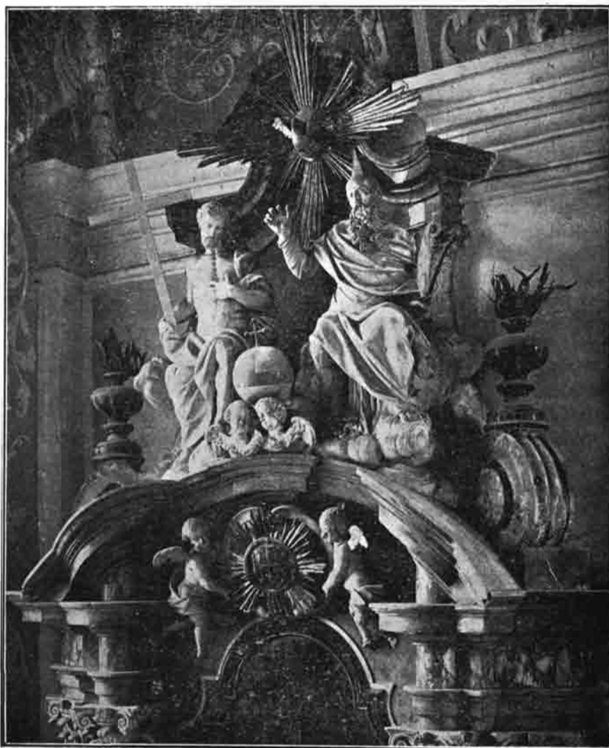
Sl. 116. Gornji dio žrtvenika sv. Ignacija u crkvi sv. Katarine u Zagrebu.

Kada su već sve kapele bile urešene, preostala je još prva na lijevoj strani. Za ovu je nadbiskup ostrogonski i knez primas ugarski Mirko Esterhazy bio odredio