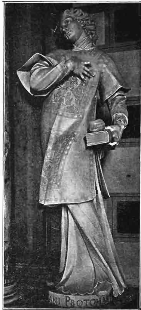
Sl. 125. Kip sv. Stjepana prvomučenika. Stajao na lijevoj strani oltara sv. Barbare u prvostolnoj crkvi zagrebačkoj. Sada na istoimenom oltaru u župnoj crkvi u Varaždinskim Toplicama.