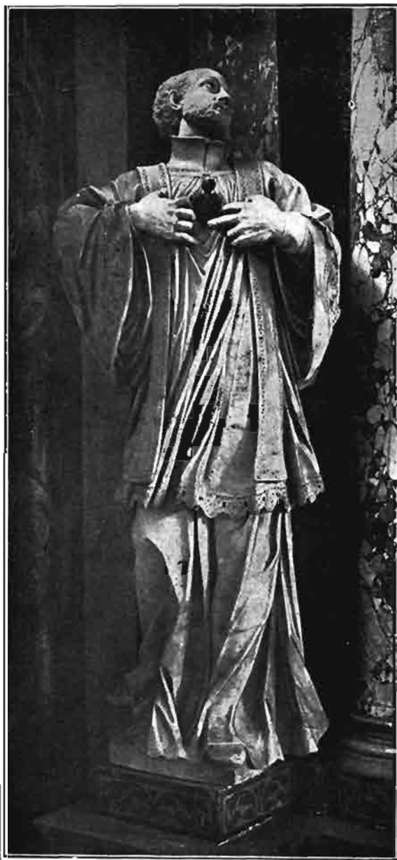
Sl. 114. Kip sv. Franje Ksaverskoga na žrtveniku sv. Ignacija u crkvi sv. Katarine u Zagrebu.

i ostali uresi dijelom iz šarenoga afrikanskoga, dijelom iz crvenoga francuskoga, a dijelom opet iz žutoga veroneškoga. Gornji i donji rub donjega dijela oltara, te podnožja pod bazama kipova bit će iz crnoga mramora, koji ima biti sjajan i