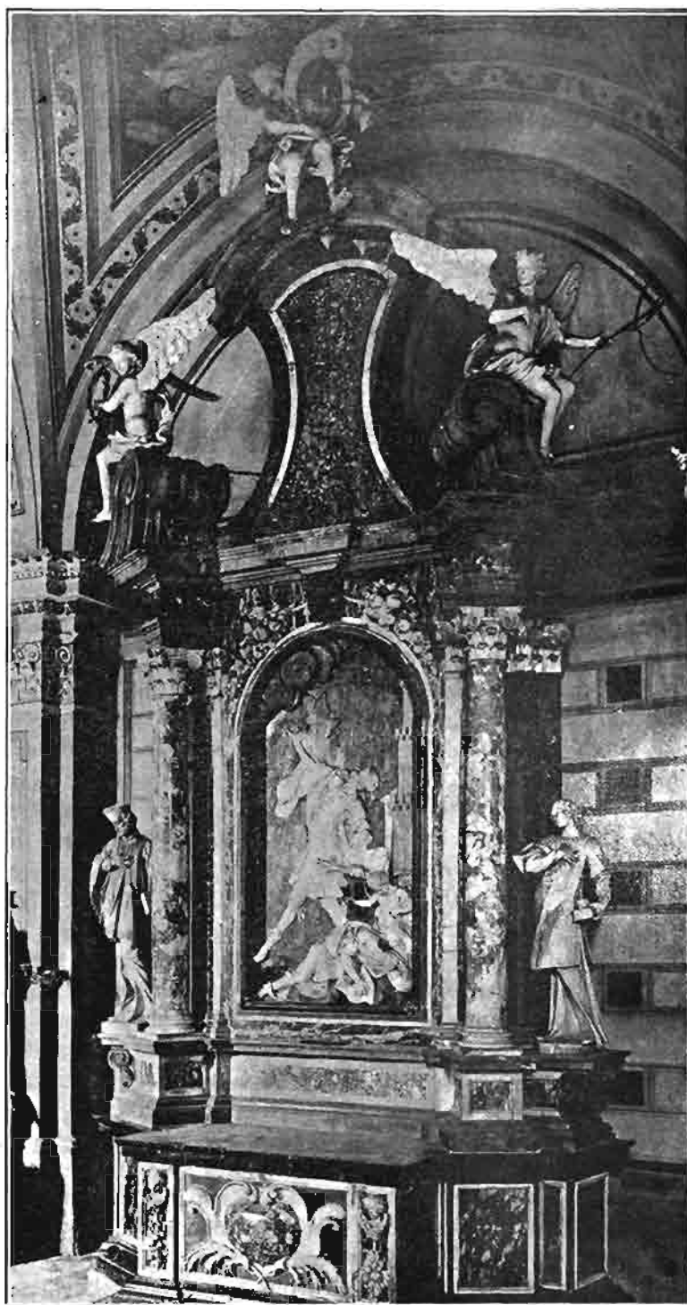
Sl. 119. Oltar sv. Barbare, prije u prvostolnoj crkvi zagrebačkoj, sada u župnoj crkvi u Varaždinskim Toplicama.

Ova dva oltara nije majstor svršio u ugovoreno vrijeme. Na ugovoru nalaze se bilješke, po kojima je 4. septembra 1730. dobio za oltar sv. Katarine 500 forinti, a 24. siječnja 1731. „dum perfecisset aram S Catharinae“, daljnjih 500 forinti. Grličić je Robbi ostao za ovaj oltar dužan još 300 forinti, koja mu je svota isplaćena iz crkvenih sredstava tek g. 1746. Oltar sv. Barbare svršio je majstor sigurno