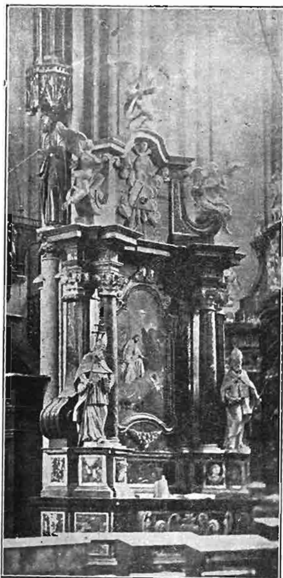
Sl. 130. Oltar presv. Trojstva izlučen iz prvostolne crkve zagrebačke. Po fotografiji snimljenoj u istoj crkvi iza potresa godine 1880.

je preuzimao i obične klesarske radnje. Nije vjerojatno, da bi za sve to vrijeme bio dospio da radi za prvostolnu crkvu zagrebačku, pa zato po svoj prilici nije iza izradbe obiju žrtvenika kraj prvih stupova lađe niti preuzimao nikakvih daljnih obveza.