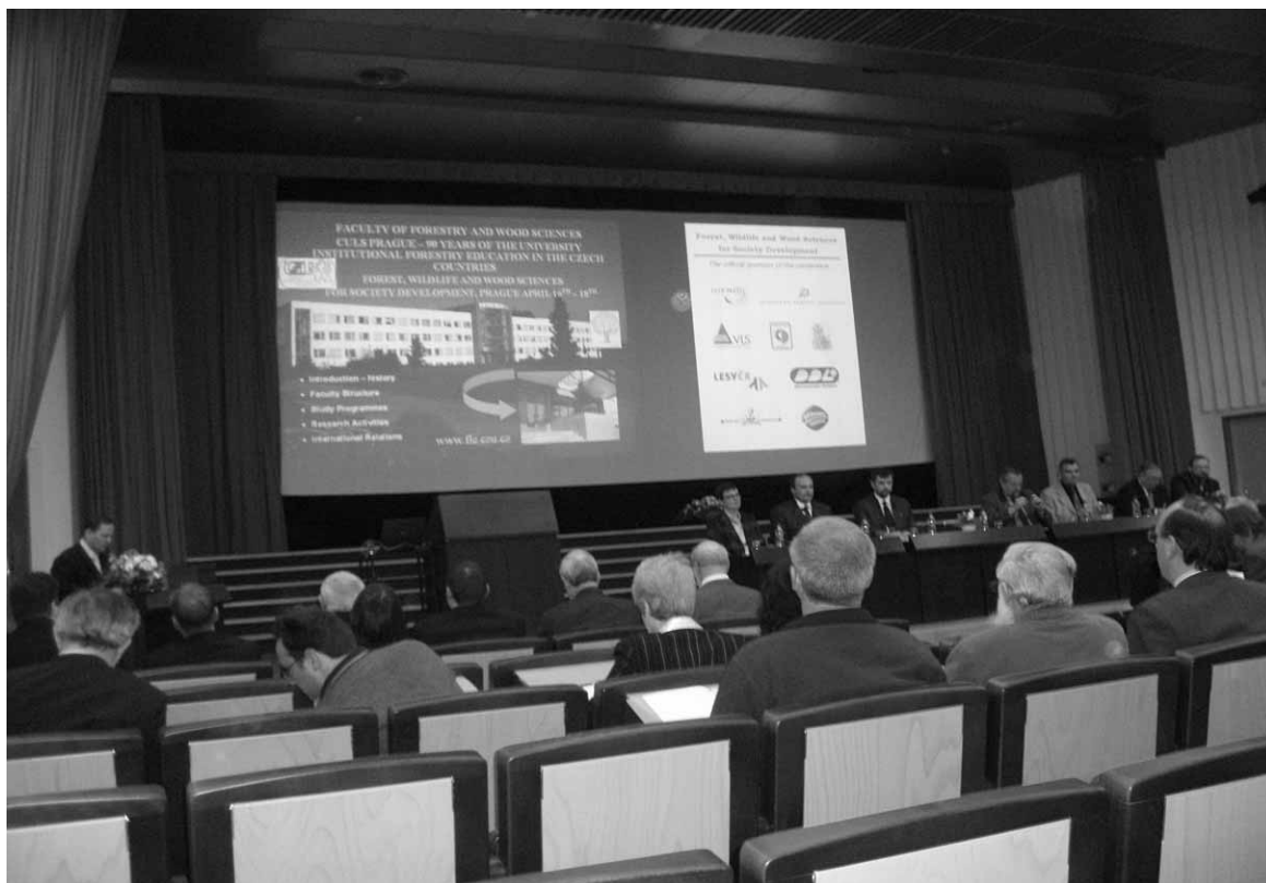
Slika 1. Otvaranja savjetovanja, govor dobrodošlice te izlaganja čelnih govornika

su se provodile istraživačke aktivnosti vezane uz šumarstvo i ekološke znanosti. Obrazovanje se tada odvijalo na poslijediplomskoj nastavnoj razini. Potpuni procvat šumarskoga obrazovanja u Pragu dogodio se 1990. godine. Danas je Fakultet šumarske i drvene znanosti (FŠD), kao sastavnica Češkoga sveučilišta bioloških znanosti u Pragu ( in Prague – CULS ), samoupravna obrazovna i istraživačka ustanova. Istraživanja provode nastavnici zajedno sa studentima. Aktivno sudjelovanje u istraživanjima zahtijeva se od svih fakultetskih predavača i istraživača. Akademski prava i sloboda primjenjuju se na znanstvene aktivnosti. Fakultet se sastoji od 7 zavoda. Oko pola radnoga vremena koristi se na obrazovanje, 30 % na istraživanja te ostatak vremena na konzultacije, participaciju u raznim stručnim tijelima i organizacijama u zemlji i inozemstvu. Danas nastavničko i znanstveno osoblje čine 54 člana, od toga 11 profesora, 14 izvanrednih profesora i 29 asistenata. Fakultet zapošljava 95 ljudi uključujući nastavnike, administrativno osoblje i radnike. Ukupni broj studenata na diplomskom, magistarskom i doktorskom studijskom programu prelazi 1500. Fakultet usko surađuje sa Sveučilišnim šumskim poduzećem ( University Forest Enterprise ), koje upravlja s više od 8000 ha šumskoga zemljišta, te služi za obrazovne i istraživačke