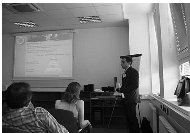
Slika 2. Izlaganje djelatnika Zavoda za šumarske tehnike i tehnologije