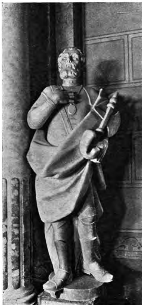
Sl. 12 i 13. Župna crkva Sv. Marije u Zagrebu. Kipovi Sv. Stjepana Kralja i Sv. Emerika na oltaru Sv. Triju Kraljeva.

Nad korintskim kapitelima stupova i pilastera iza njih diže se epistil od sivo-crvenkastog gustog vapnenca i kararske breče na kojem počiva gornji dio oltara koji je sasvim jednostavan: na krajevima raščlanjenog vijenca nalaze se okrajci prekinutog zabata, a između njih, u sredini, prislonjena stijeni vaza (na plošnom duguljastom i na svom gornjem kraju u volutama prema unutra uvinutom postamentu) iz koje suklja plamen.