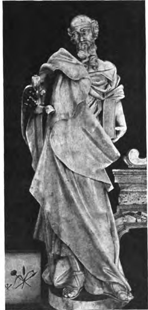
Sl. 4 i 5. Župna crkva Sv. Marije u Zagrebu. Kipovi Sv. Petra i Pavla na glavnom oltaru u svetištu.

Pristupa mu se trima stepenicama, od kojih je na najvišoj, tamo gdje stoji svećenik, umetnut velik pravokutnik sastavljen od crnih, crvenih, žutih i bijelih pločica, a okviren rubom od bijelog mramora.