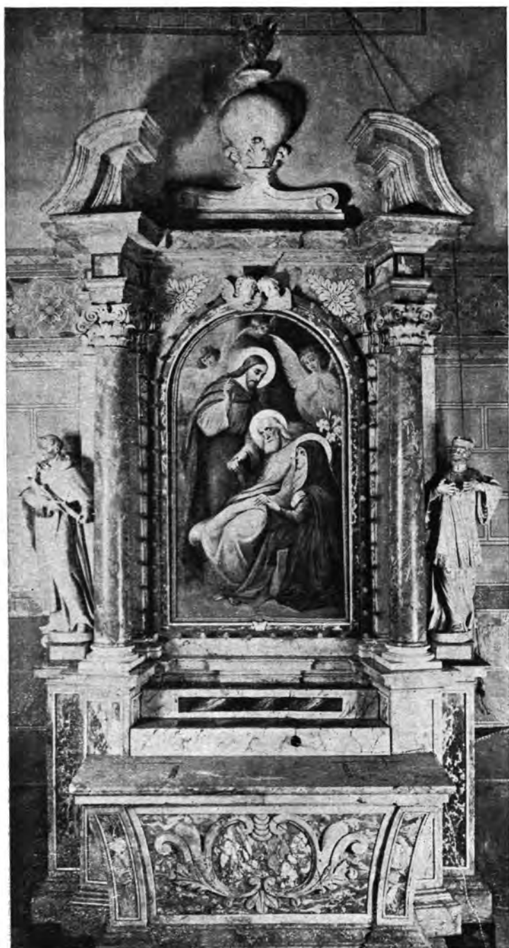
Sl. 6. Župna crkva Sv. Marije u Zagrebu. Oltar Sv. Josipa.