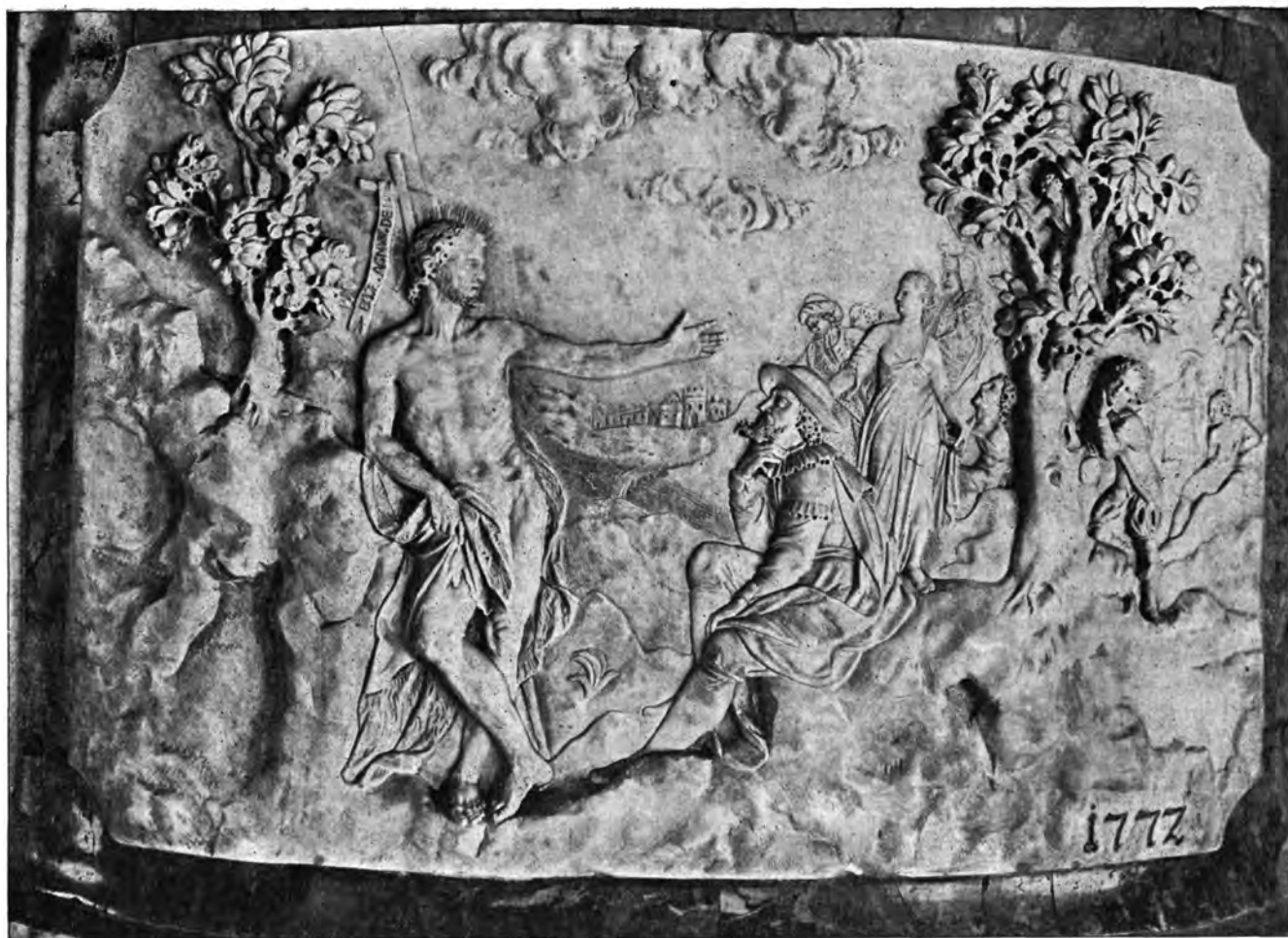
Sl. 2. Župna crkva Sv. Marije u Zagrebu. Ivanove propovijedi Židovima Mramorni reljef na propovjedaonici.