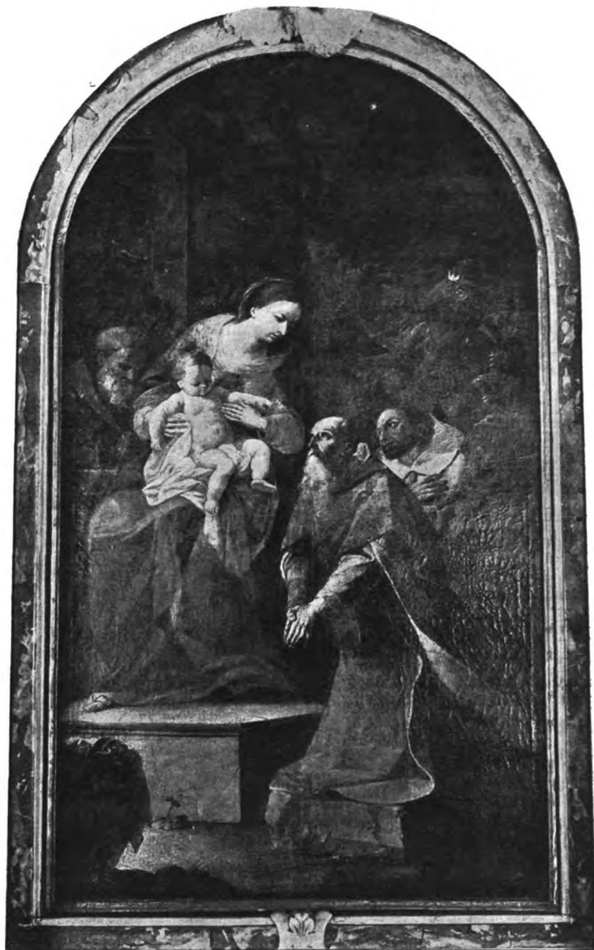
Sl. 1. Župna crkva Sv. Marije u Zagrebu, Poklonstvo Sv. Triju Kraljeva Oltarna slika od Antona Cebeja iz g. 1770.