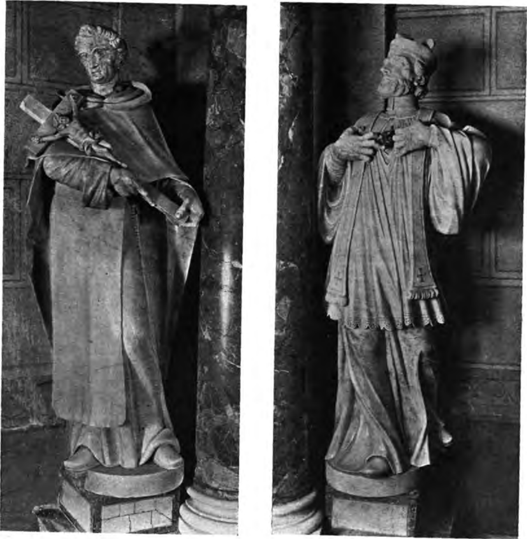
Sl. 8 i 9. Župna crkva Sv. Marije u Zagrebu. Kipovi Sv. Antuna i Sv. Franje Ksaverskoga na oltaru Sv. Josipa.

menze, drvena su imitacija mramora. — U srednjem se dijelu oltara, u sredini nalazi u okviru od crveno-bijele slovenačke mramorne breče slika »Smrti Josipove« odnosno »Pietà«. Na vrhu tog okvira izrađene su dvije priljubljene andeoske glavice, a u uglovima nad slikom, na pozadini od sivo-crvenkastog gustog vapnenca, bijeli ornament hrastova lišća. — Lijevo i desno sa strane oltara stoje okrugli stupovi sa korintskim glavicama od brečastog gustog, crveno-zelenkastog vapnenca, a iza njih su prislonjena stijeni po tri raznobojna pilastra. — Kraj stupova sa kraja oltara, stoje na malim četverouglatim ležajima i okruglim bazama statue SS. Antuna i Franje Ksaverskog, odnosno Sv. Margarete od Cortone i Efrema pustinjaka i pokajnika.