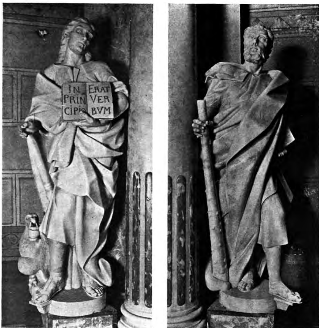
Sl. 14 i 15. Župna crkva Sv. Marije u Zagrebu. Kipovi Sv. Ivana Evangeliste i Apostola Tadeja na oltaru Sv. Anc.

umetnut je opet pravokutnik od bijelih, crvenih, žutih i crnih pločica, omeden okvirom od crnog gustog vapnenca. — Antependij nema tri polja već samo jedno, a na njegovoj je pozadini od crveno-bijele slovenačke mramorne breče izraden ornamente koji uokviruje plohu oblika jabuke i koji je uglavnom jednak onom na prvim dvima oltarima. Lijeva i desna strana oltarnog stola ne završuju oštrim bridovima kao prije, već nekim malo uvinutim volutama. S obje strane menze stoje opet po dva uglata polustupa sa umetnutim pločama (od crveno-bijele slovenačke mramorne breče i kararske breče), od kojih se