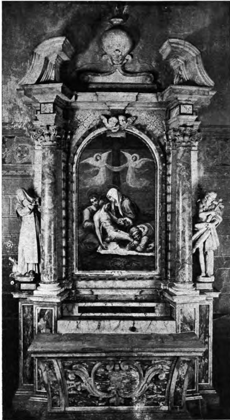
Sl. 7. Župna crkva Sv. Marije u Zagrebu. Oltar Sv. Marije Žalosne.