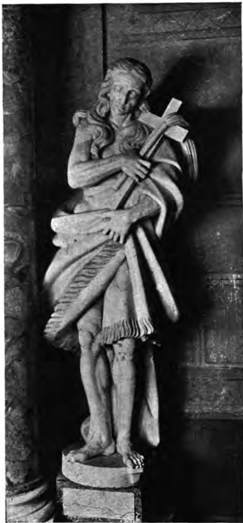
Sl. 10 i 11. Župna crkva Sv. Marije u Zagrebu. Kipovi Sv. Margarete Kortonske i Sv. Efrema Pokajnika na oltaru Sv. Marije Žalosne.

(Sv. Antun odjeven u dugu monašku haljinu sa krunicom pričvršćenom o pojas i sa raspelom u rukama potpunoma potsjeća na Margaretu Kortonsku sa sličnom draperijom i sa sličnim raspelom. (Kraj Margarete Kortonske leži sa strane pas.) Franjo Ksaverski je u roketi koju je otkopčao pokazujući srce, iz kojeg suklja plamen. Golo tijelo Efrema pokajnika ogrnuto je teškim i debelim plaštem prebačenim preko ramena lijeve ruke kojom ga i pridržaje u visini pojasa. — Desnom rukom grčevito stišće — prislonjene na desno rame — simbole svog mukotrpnog i pokajničkog života: križ i bič.)