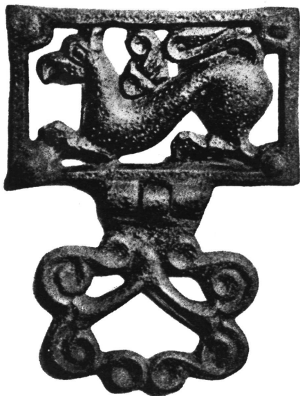
Ukrasni okov. Panonija.