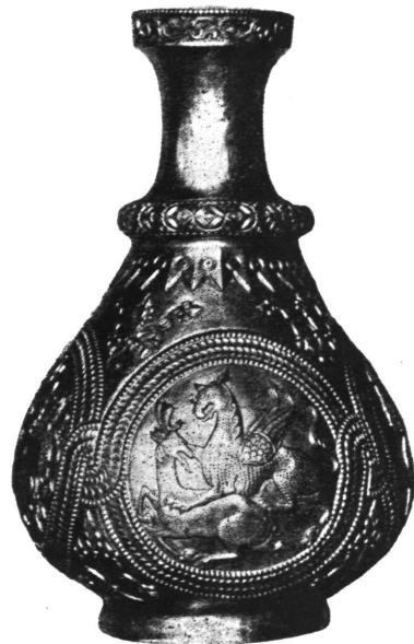
Vrč. Nagy-Szent-Miklós (Panonija).

avarska grobišta sadrže brončane okove na pojasima, uresne pločice, privjeske i sl. Nov ornament je geometrijska vitica — životinjski motivi su rijetki. Mnoge brončane umjetnine potječu još iz azijske postojbine Avara, što vrijedi — mutatis mutandis — za metalne kulture Mađara. Ove potonje, kao i kulture Pečenega, Kazara, Kumana, Bugara i ostalih naroda koji dolaze ovamo, a također i odnos Avara i Slavena, nije moguće da ovom zgodom dalje razradimo. Sve te etničke skupine, koje su živjele nomadskim životom, čine sastavni dio čovječanstva ranog srednjeg vijeka, te su i suviše važan činilac u historijskom procesu toga doba. Na kraju treba primijetiti, da se životinjski stil kod ovih kasnijih naroda Eurazije malo po malo gubi, odnosno miješa s umjetnošću visokih kultura, koje se prostiru južno od stepске zone. Izrazit je primjer poznati nalaz od Nagy-Szent-Miklós-a; to se blago sastoji od 23 zlatne posude, i na njima ima dosta helenističkih, zapravo sasanidskih elemenata. Nazivano »Atilinim blagom«, ono je nekada pripisivano Hunima. Po svemu međutim izgleda da je taj nalaz kasnijeg podrijetla, dakle avarskog ili pečeneškog, terminus post quem non je 9—10 st. pos. Kr.