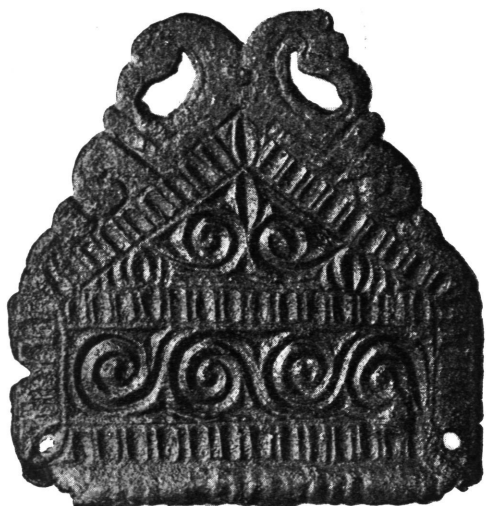
Ukrasna pločica. Solin.