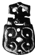
Kopča. Novi Banovci na Dunavu.