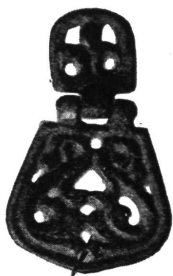
Ukrasni okov. Novi Banovci na Dunavu.