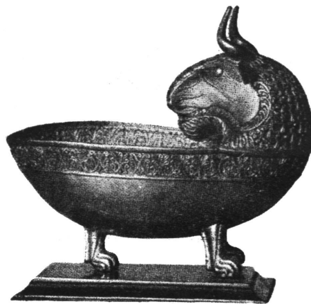
Posuda. Nagy-Szent-Miklós (Panonija).

avarska grobišta sadrže brončane okove na pojasima, uresne pločice, privjeske i sl. Nov ornament je geometrijska vitica — životinjski motivi su rijetki. Mnoge brončane umjetnine potječu još iz azijske postojbine Avara, što vrijedi — mutatis mutandis — za metalne kulture Mađara. Ove potonje, kao i kulture Pečenega, Kazara, Kumana, Bugara i ostalih naroda koji dolaze ovamo, a također i odnos Avara i Slavena, nije moguće da ovom zgodom dalje razradimo. Sve te etničke skupine, koje su živjele nomadskim životom, čine sastavni dio čovječanstva ranog srednjeg vijeka, te su i suviše važan činilac u historijskom procesu toga doba. Na kraju treba primijetiti, da se životinjski stil kod ovih kasnijih naroda Eurazije malo po malo gubi, odnosno miješa s umjetnošću visokih kultura, koje se prostiru južno od stepске zone. Izrazit je primjer poznati nalaz od Nagy-Szent-Miklós-a; to se blago sastoji od 23 zlatne posude, i na njima ima dosta helenističkih, zapravo sasanidskih elemenata. Nazivano »Atilinim blagom«, ono je nekada pripisivano Hunima. Po svemu međutim izgleda da je taj nalaz kasnijeg podrijetla, dakle avarskog ili pečeneškog, terminus post quem non je 9—10 st. pos. Kr.