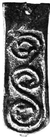
Okov s remena. Velika Gorica kod Zagreba.