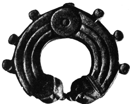
Ukrasni okov. Ptuj.