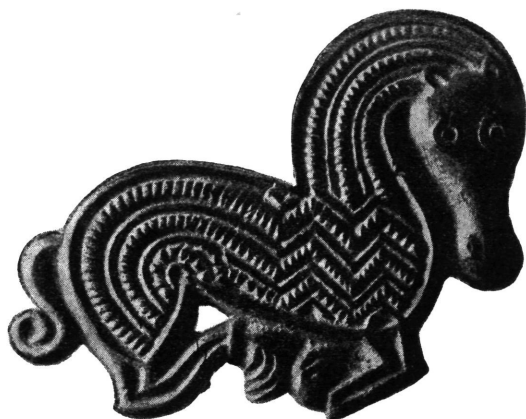
Ukrasna pločica. Biskupija kod Knina.