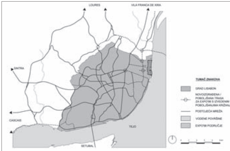
Sl. 2. CESTOVNA INFRASTRUKTURA – LISABON EXPO'98 Fig. 2 ROAD INFRASTRUCTURE – LISBON EXPO'98