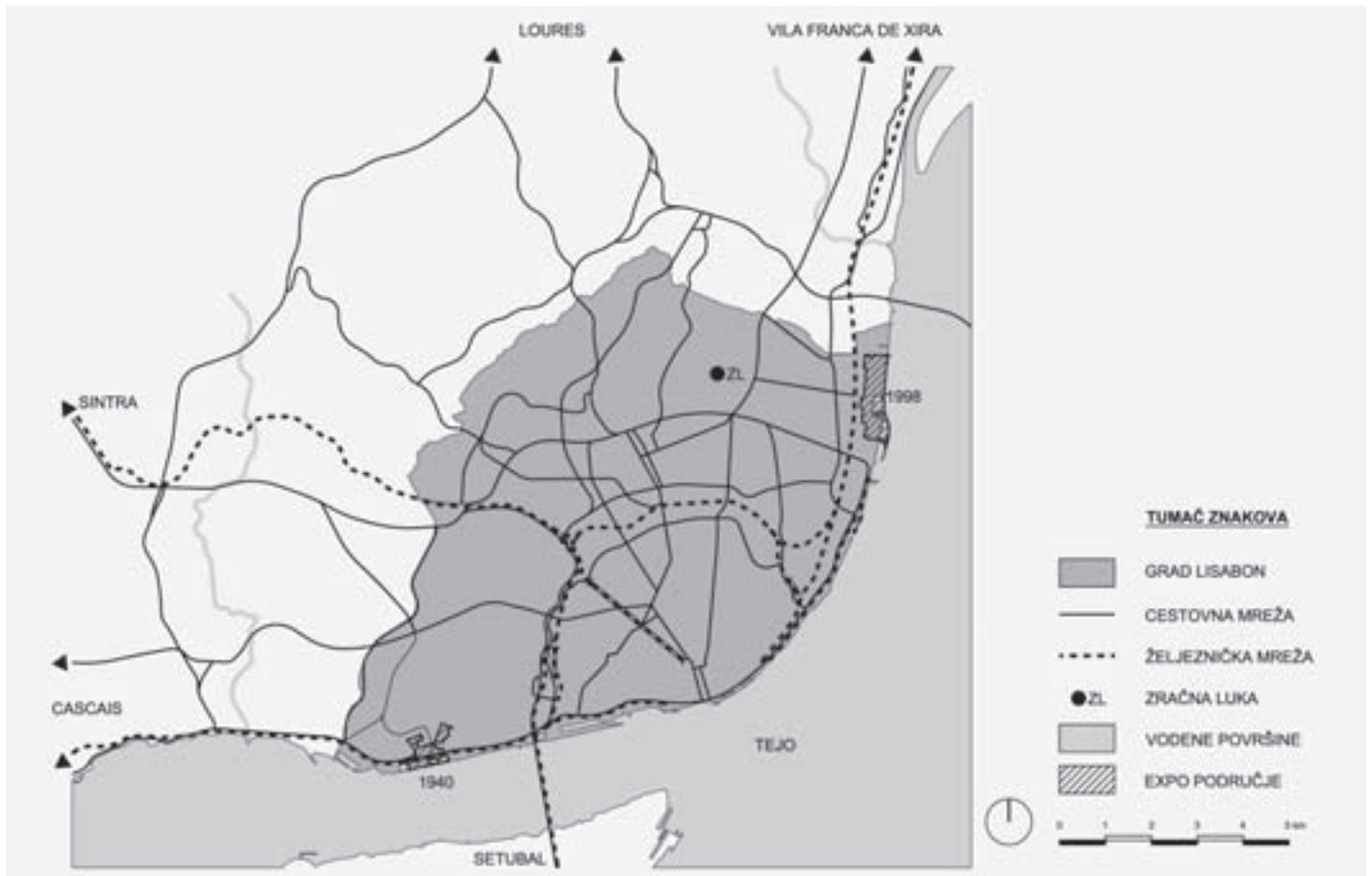
SL. 1. LOKACIJA IZLOŽBENOG PODRUČJA U URBANOJ MATRICI LISABONA FIG. 1 LOCATION OF THE EXHIBITION SITE, URBAN MATRIX OF LISBON