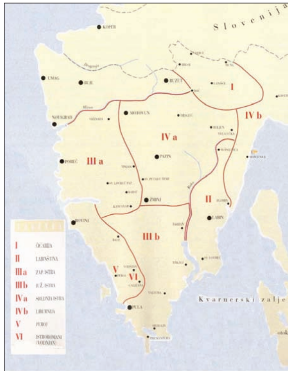
Karta 1. Područja tipova ženskih nošnji u Istri (iz: Radauš Ribarić, Jelka: Ženska narodna nošnja u Istri)

Čim progovore ja prepoznam – oni govore na č, mi na ć, npr. gremo ča – gremo ća; razlika je očita. Mi ćemo reć: 'Kade si bi', a oni će reć: 'Kadi si bija?' ili 'Ćeš pojti', a mi 'Ćeš puoć' 5 ... i naglasak je drugačiji. 6