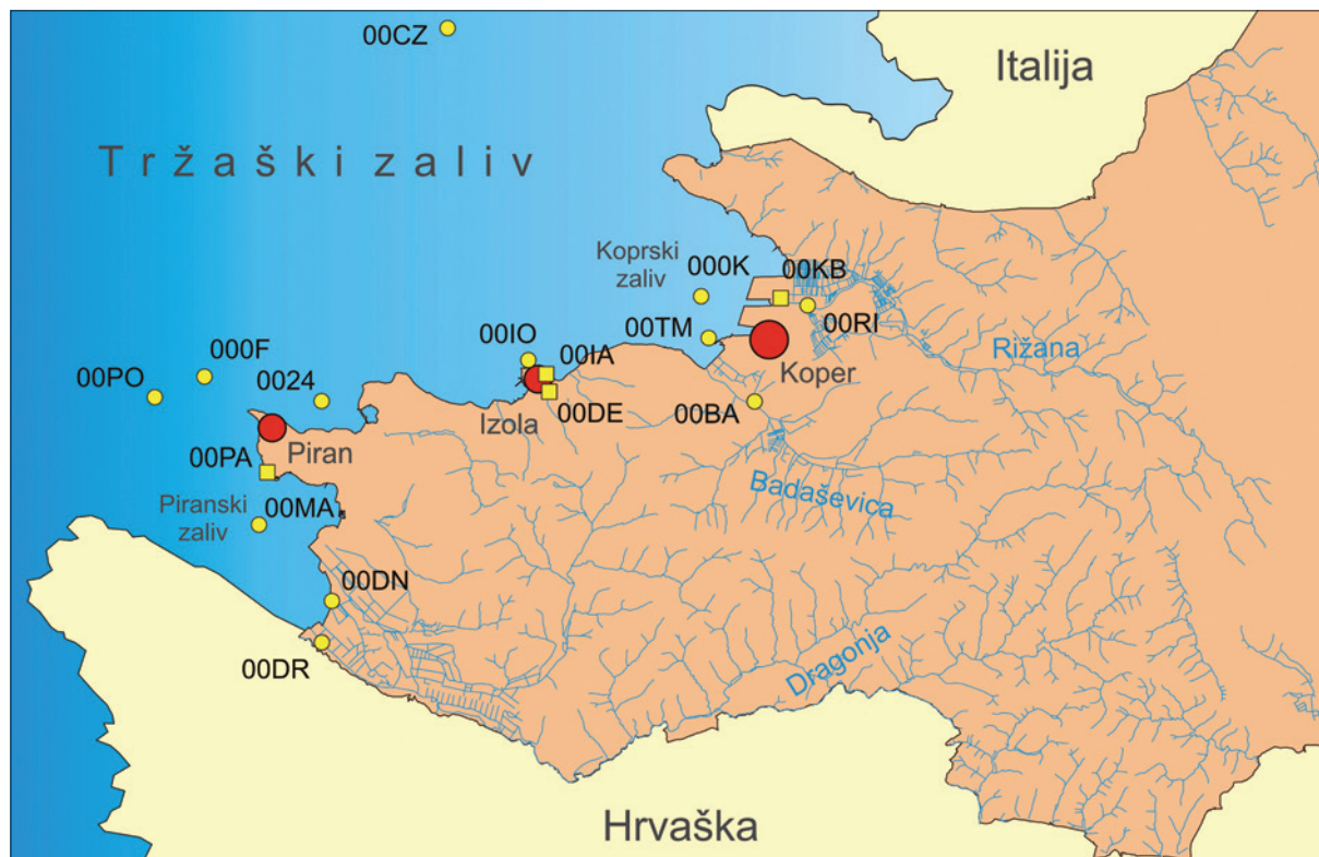
Slika 3. Mjesta mjerenja (monitoringa) kakvoće i opterećenja mora

000K – zaljev Koper; 00MA – zaljev Piran; 0024 – Strunjan; 00TM – marina Koper; 00RI – Rižana; 00BA – Badaševica; 00DR – Dragonja; 00DN – Drnica; 00KB – uređaj za čišćenje komunalnih otpadnih voda Koper; 00IA – uređaj za čišćenje komunalnih otpadnih voda Izola; 00PA – uređaj za čišćenje komunalnih otpadnih voda Piran; 00DE – uređaj za čišćenje komunalnih otpadnih voda Delamaris Izola; 00PO – podvodni ispust Piran; 00IO – podvodni ispust Izola; 00CZ – centar Tršćanskog zaljeva; 000F – JZ dio Tršćanskog zaljeva