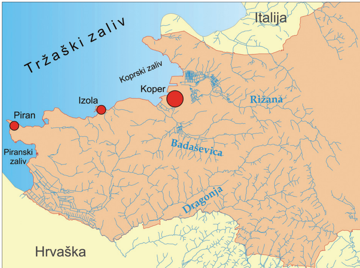
Slika 2. Slovenski dio Jadranskoga mora s područjem uz vodu Figure 2 Slovenian part of the Adriatic Sea with its waterbasin

se način navodno oblikovao i spomenuti bazen (OROŽEN ADAMIĆ, 2002.). Morsko je dno većinom sastavljeno od fliša, dijelom od vapnenca i riječnih sedimenata. Vode s kopna donose u slovensko obalno more velike količine ilovače, gline i mulja (RICHTER, 2005.). To značajno utječe na prozirnost ili mutnost vode. Prosječna vidljivost kreće se između 6 i 8 m, a rijetko premašuje 10 m (REJEC BRANCELJ, 2003.). U usporedbi s ostalim Jadranom, površinske su morske struje u njegovu sjevernom dijelu, a time i u slovenskom dijelu mora znatno slabije. Zbog plitkosti Tršćanskoga zaljeva smjer i brzina struja usko su povezani s trenutnom vremenskom situacijom. Na njihovu brzinu i smjer utječu jaki vjetrovi, a na cjelokupan vodeni stupac utječe također i bibavica. Glavna morska struja teče od Istre, prosječnom brzinom od približno 0,8 čvorova (1,5 km/h), a vraća se uz talijansku obalu, brzinom od 0,5 čvorova (0,9 km/h) (PLUT, 2000.). Pred Savudrijskim poluotokom dijeli se u dva kraka, jedan nastavlja