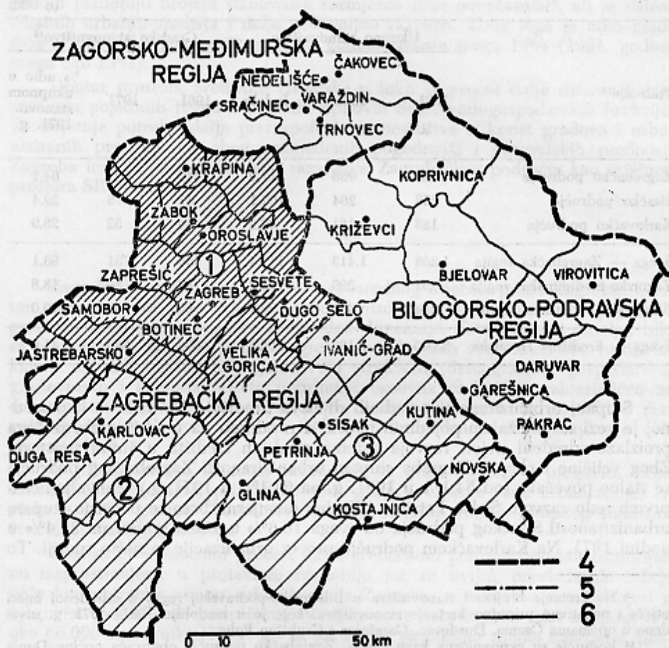
Sl. 1. Gradska naselja (po statističkoj definiciji) na području Središnje Hrvatske. Oznaka područja: 1 — Zagrebačko područje, 2 — Karlovačko područje, 3 — Sisačko područje. Oznaka razgraničenja: 4 — granice regija, 5 — granice užih područja unutar Zagrebačke regije, 6 — granice općina.

meno se stanovništvo Zagorsko-međimurske regije povećalo za 2,8%, a u Bilogorsko-podravskoj regiji čak smanjilo za 5,3%. Na području Središnje Hrvatske u cjelini stanovništvo se kroz isto razdoblje povećalo za 6,5% 12 . Navedeni podaci govore o teritorijalnoj preraspodjeli stanovništva šireg domašaja značenja. Tako npr. Bilogorsko-podravska regija gubi stanovništvo u korist