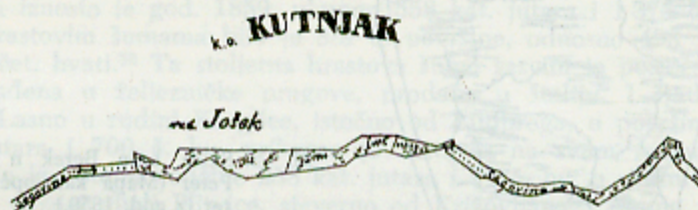
Sl. 2. Skica predjela u rudini Jošek kat opć. Kutnjak (Mapa kat. opć. Kutnjak iz god. 1859.)

Potok Segovina izvire ispod Riječkih Krča nedaleko od Dugeréke — sada Duge Rijeke —, međutim, na Antaverovu manuskriptu izvor Segovine premješten je suviše na istok i podaleko od spomenutog sela. Pažljiv promatrač lako će zapaziti na manuskriptu da je Antaver južno od sela Antolovca i Kutnjaka malo zadebljao liniju koja označava tok Segovine, kao i to da ona ima dalje od tog mjesta novo ime, Bednica, a od sela Zablatja i treće ime, Prudnica, pod kojim i uvire u Dravu. (Na suvremenim kartama Segovina nije prikazana kao pritok Drave). Iako je od Antaverova manuskripta do izrade prvih katastarskih mapa u 1859. prošlo sedam desetljeća, pokušali smo u mapama XIX st. pronaći razjašnjenje te Antaverove kartografske enigme. 28 Na katastarskoj mapi sela Kutnjaka vidi se jasno da se Segovina južno od Antolovca — upravo tamo gdje je njen tok označio Antaver debljom linijom — razlijeva u barovitom predjelu rudine Jošek i da na tom lokalitetu nestaje kao voda tekućica. Na mapi je uočljivo i to da Segovina nakon stotinjak metara iznova stvara svoje korito, ali ubrzo ponovno nestaje u močvarnom Jošku (sl. 2). Na tom predjelu nalazi se izvor potočića Prodnice. Taj