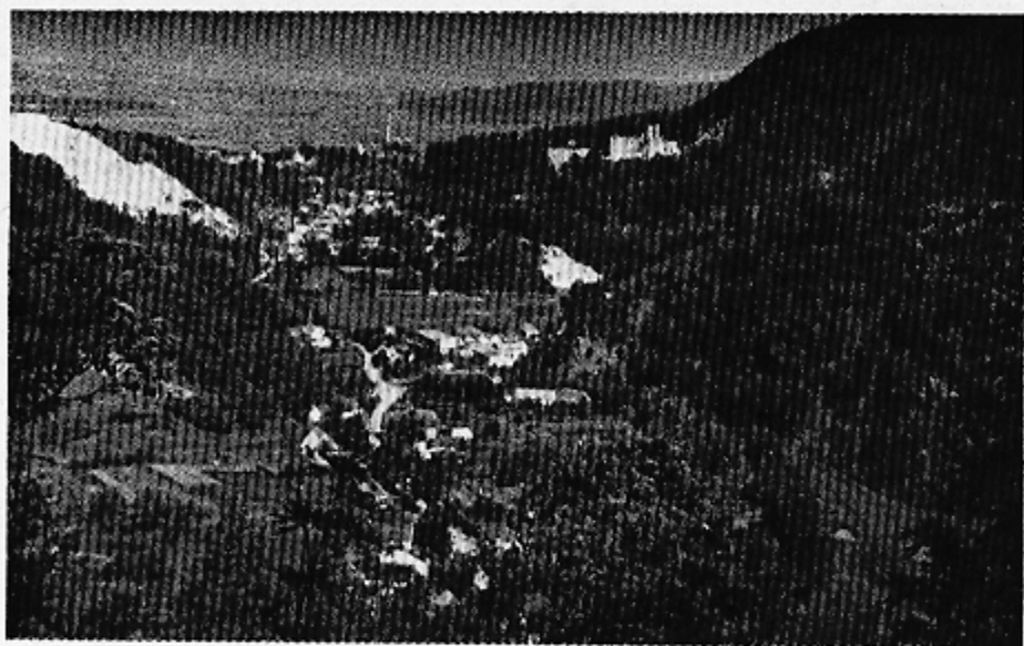
Fot. 1. Pogled na Samobor iz zaselka Gradišće. Crkveni zvonici su na kraju starog dolinskog dijela i dalje na ravnici širi se noviji industrijsko- stambeni dio. Desno ruševine starog grada.

Phot. 1. La vue de Samobor prise du hameau Gradišće Les clochers d'église bordent le vieux quartier pendant que le quartier plus récent (habitation et indu- strie) s'étend plus loin dans la plaine. A droite les ruines de l'ancien château fort.