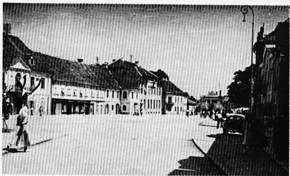
Fot. 2. Glavni trg u Samoboru. Trg je imao gotovo isti izgled početkom druge polovice 19. stoljeća.

Phot. 1. La vue de Samobor prise du hameau Gradišće Les clochers d'église bordent le vieux quartier pendant que le quartier plus récent (habitation et indu- strie) s'étend plus loin dans la plaine. A droite les ruines de l'ancien château fort.