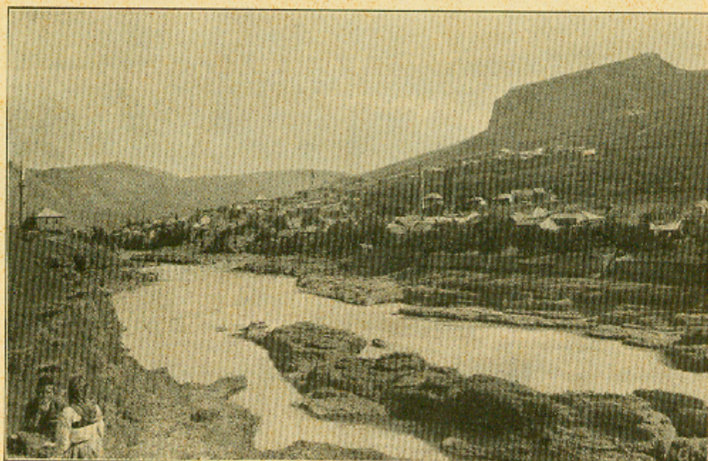
Dolina Neretve kod Mostara.

Dolina Neretve. U glacijalno doba kad su visoki isponi sliva Neretve bili pokriti ledom, kotrljala je njena voda nizbrdo po svom koritu mnogo kamenja. Krupni su se komadi smirili odmah u blizini ledenika, dok je sitnije komade ona