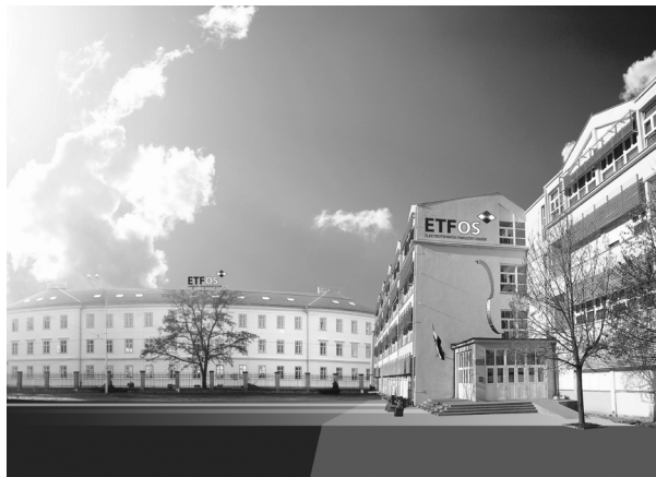
Slika 5. Elektrotehnički fakultet Sveučilišta Josipa Jurja Strossmayera u Osijeku

više osuvremenjuju i nadopunjuju, pružaju mogućnost kvalitetnog obrazovanja na području tehničkih znanosti, ravnopravno s obrazovanjem na europskim i svjetskim fakultetima. Ono što odlikuje ove fakultete je kvalitetna suradnja s gospodarstvom gdje u pravilu njihovi studenti pronalaze zaposlenje još prije nego li diplomiraju ili odmah nakon završenog studija. Zbog deficitarnosti završenih studenata elektrotehnike, građevine i strojarstva na tržištu rada, danas vrijedi pravilo: s fakulteta na posao!