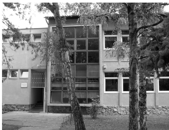
Slika 1. Strojarški fakultet u Slavonskom Brodu. Zgrada na Trgu I. B. Mažuranić 2 (lijeva slika) i zgrada u Gundulićevoj ulici na broju 20A (desna slika).