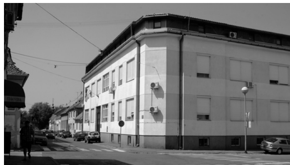
Slika 2. Zgrade Građevinskog fakulteta Osijek u Drinskoj i Crkvenoj ulici