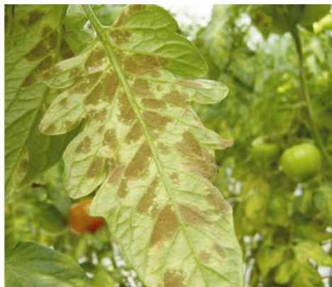
Slika 1. Simptomi na listu rajčice

Picture 1. Symptoms on tomato leaves