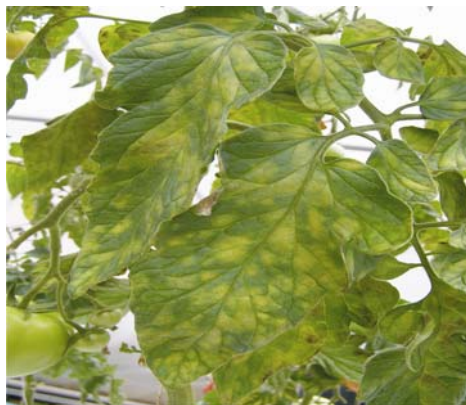
Slika 2. Simptomi na listu rajčice

Picture 1. Symptoms on tomato leaves