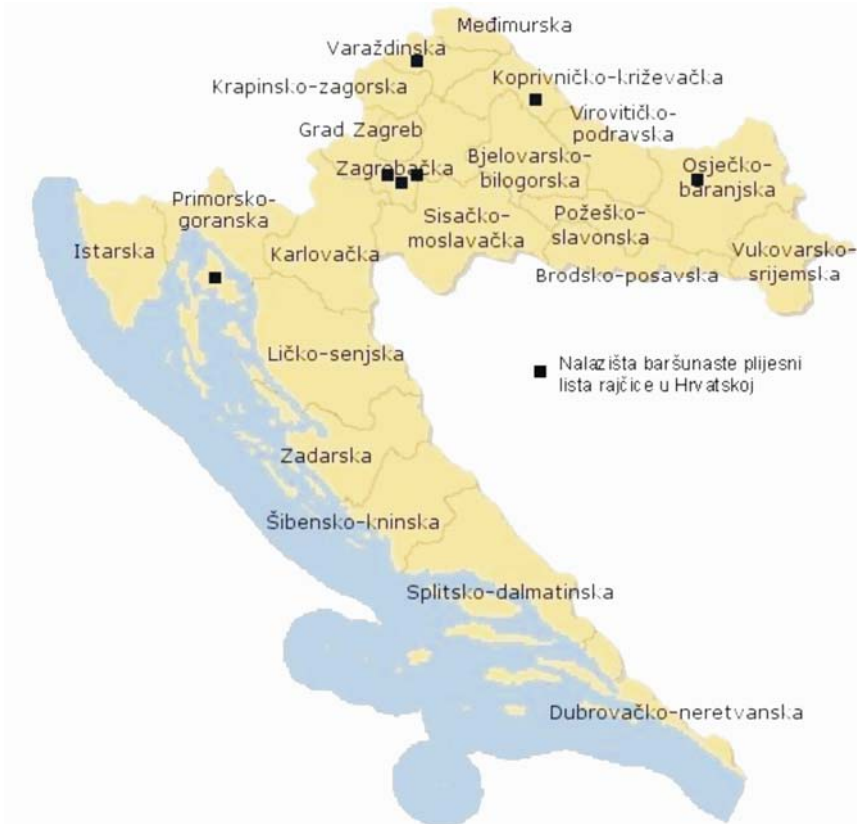
Karta 1. Rasprostranjenost baršunaste plijesni lista rajčice u Republici Hrvatskoj