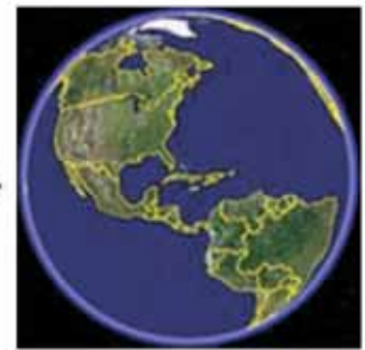
2. Google Earth Image Base