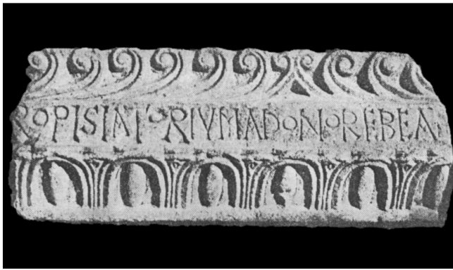
Sl. 1 Ulomak predromaničkog arhitrava s natpisom; bazilika sv. Mihovila na Prevlaci u Boki Kotorskoj (prema J. Kovačević 1973, str. 38).

crkvenih knjiga te kršćanskih obrednih priručnika: specifični liturgijski pojmovi, biblijski citati i parafraze, izvanci iz antifona i sl. U odnosu na graditeljska i skulptorska ostvarenja, teže ćemo takve liturgijske elemente na epigrafičkim spomenicima imati sreće iščitati putem cjelovito sačuvanih tekstova jer nerijetko dolaze do nas u fragmentima, često samo poneka krnja riječ kojoj se smisao daje tek nazrijeti. No, na sreću, nađe se i ulomaka s dovoljno sačuvanog teksta, poput primjerâ koji su predmetom ovoga rada, gdje tumačenje zapisanoga otkriva neke pojedinosti što obogaćuju dosadašnje znanje, konkretno o izgledu obrednog prostora u sklopu sakralne građevine. Ovdje ćemo se pozabaviti liturgijskim nazivljem, točnije dvama izabranim pojmovima što se u natpisima odnose na dijelove crkvene opreme, mobilijara, a koji su izravno vezani uz izgled te funkciju svetišta i oltara - središnje točke čitava bogoslužnog prostora.