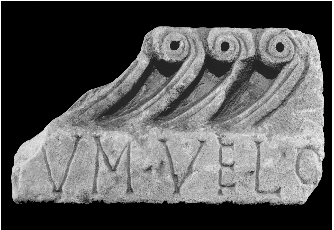
Sl. 2 Ulomak predromaničkog arhitrava s natpisom; crkva sv. Martina u Pridrazi kod Zadra (Foto: Z. Alajbeg).

Kovčeg Staroga Zavjeta, a koji se /sc. propitiatorium / još zove Pokrivalo / Tegmen / ili zaklopac Kovčega.”) (Du Cange 1954, VI-VII : 533).