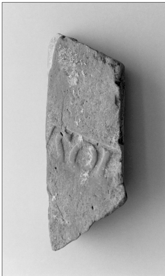
Sl. 4. Ulomak tegule s djelomično sačuvanim žigom radionice SOL...

Nalazi opeka s pečatom ove radionice brojni su na našem primorju; najučestaliji su na povijesnom prostoru sjeverne Liburnije, u Istri i na Kvarnerskim otocima, te Hrvatskom primorju (područja na kojima je dosada jedino i napravljena statistička analiza žigova), a potom i u Dalmaciji, i to na području rimskog Jadera i Salone. Po rasprostranjenosti i brojnosti pripadaju vodećoj skupini žigova, dok se po učestalosti bilježe iza Pansiane i A. Faesonie , a nakon koje (sc. Solonas ) slijedi žig Q. Clodius Ambrosius (Matijašić 1984: 290-291; 1989: 62-63,67, 1994: 57,64).