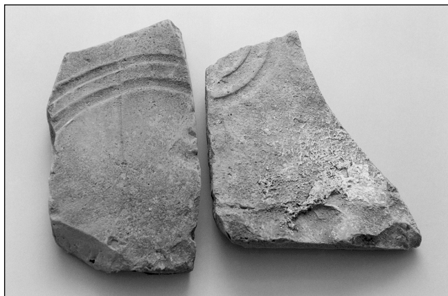
Sl. 1. Ulomci tegula s utisnutim žljebovima

sistematizacijom i kategorizacijom materijala 3 definirane su dvije osnovne vrste krovnih opeka: tegulae i imbrices (Matijašić 1984: 289; 1989: 61), koji se u otprilike jednakom omjeru pojavljuju u dvije boje: žutoj (svijetložutoj) i crvenoj (svijetlocrvenoj) (Matijašić 1989: 62) 4 . Ulomci obiju vrsta, zbog stanja sačuvanosti, različitih su dimenzija te prosječne debljine između 1,2 i 3,6 cm, a izrađeni su od manje ili više pročišćene gline.