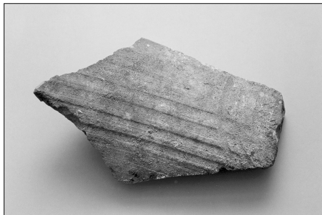
Sl. 2. Ulomak imbreksa s utisnuti užljebljenjima

Na dva ulomka tegula svijetlocrvene boje (dim. 12 x 20 x 3,5 cm; 17 x 18,5 x 2,5 cm) utisnuti su polukružni paralelni žljebovi, poput blage valovnice (sl.1), a na jednom ulomku imbreksa žute boje (dim. 14 x 21 x 2 cm) ravni paralelni žljebovi, poput kanelura, koji su presječeni plitkim polukružnim i paralelnim užljebljenjima ( sl. 2). Utiskivani su prstima ili nekom pomoćnom alatkom prije pečenja, i moguće je da predstavljaju neke interne, raspoznatljive znakove (sigle) keramičara, možda u svrhu označavanja količine izrađenog materijala ili pak mjere pripremljene za daljnje korištenje. Tegule s polukružnim užljebljenjima, kao i s nešto složenijim motivima, poput petlji, kružnica i sl., nisu rijetkost na antičkim, rimskim lokalitetima, pa začuđuje da se o njima dosada malo pisalo (Matijašić 1986: 205-206). Valja podsjetiti da su se i na području Makarskog primorja tegule sa sličnim znakovima