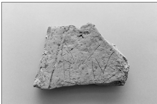
Sl. 3. Ulomak imbreksa s upanim rimskim brojevima

jedna od autohtonih civitates , u obalnom dijelu Aemiliae, u Regio VIII. Uočeno je da je to jedini žig rimskih radionica za koji se sa sigurnošću može pretpostaviti da predstavlja ime etničke zajednice, kao pravne osobe, a ne ime vlasnika kao fizičke osobe. Opeke s ovim žigom proizvodile su se u radionicama u okolici Ravene i na prostoru delte rijeke Po. S obzirom da je po tipu slova i obliku natpisnog polja, vrlo sličan žigovima Pansiane , vremenski se smještaju u prvu polovicu 1. stoljeća (Matijašić 1989: 64-66). Posebno je zanimljivo što je ulomak tegule s Grebišća, s navedenim žigom, drugi nalaz takve vrste otkriven dosada na Makarskom primorju. Naime, u prošlom stoljeću je u Promajni pronađena tegula sa žigom SOLONAS , o čemu prvi podatak donose Th. Mommsen i F. Bulić, a koja se nije sačuvala, kao što nije ubiciran ni ranorimski antički objekt u Promajni uz koji se ista eventualno može vezati (Medini 1970: 24). 5