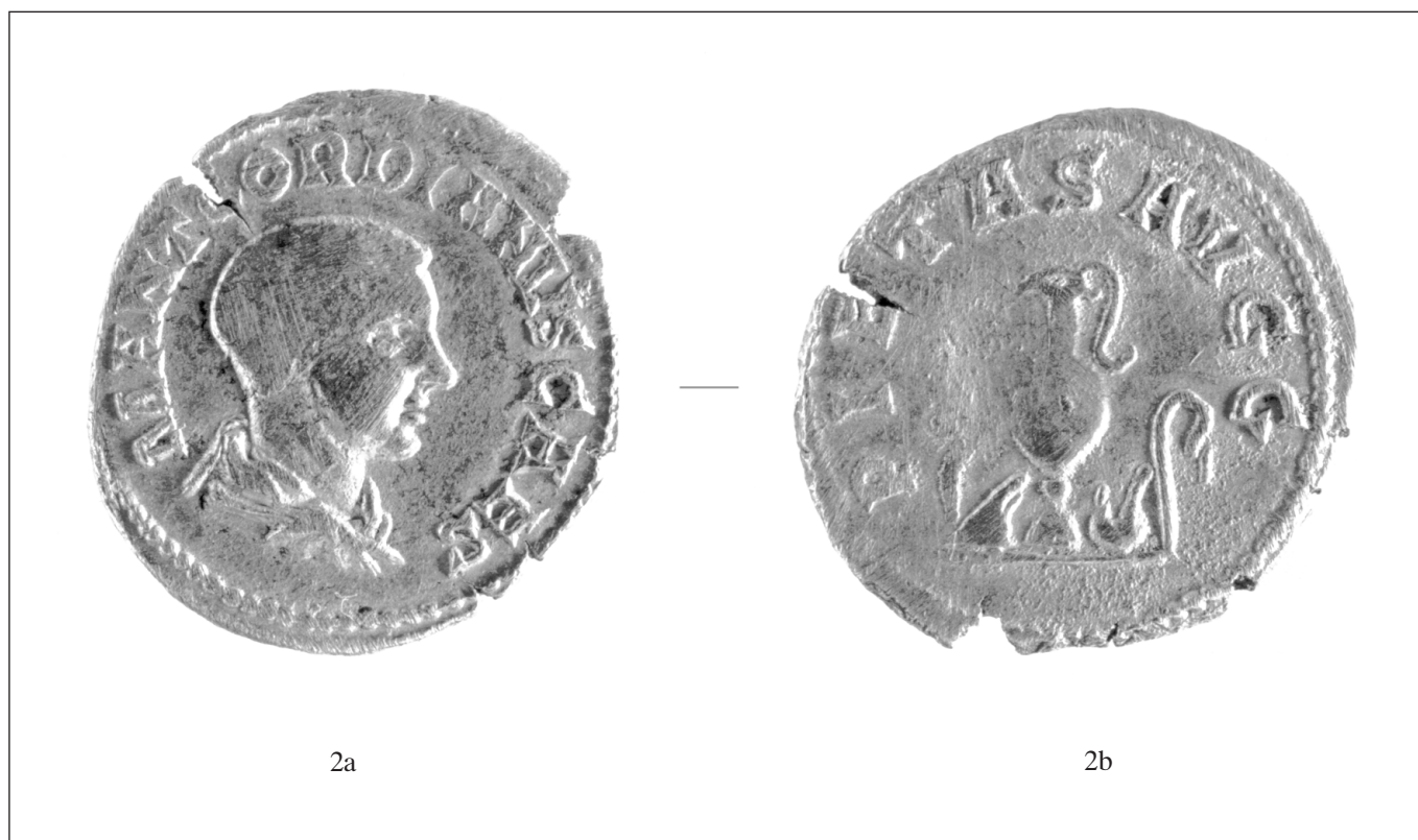
Sl. 2 denar Gordijana III. kao cezara