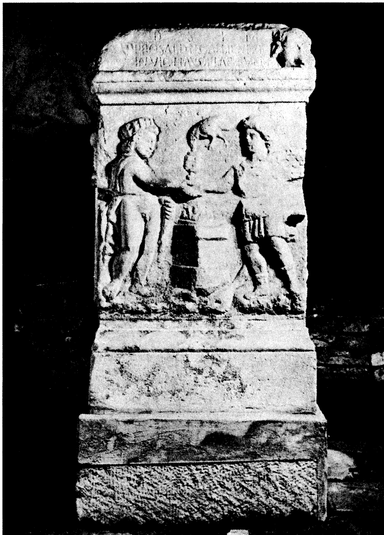
Sl. 4. Ara iz III mitreja u Ptuj. Na pročelju prizor družbe Sola i Mithre (broj 90)

odori, l. Sol nag, s ogrtačem prebačenim preko ramena s šesterozrakom krunom na glavi. Desnu je ruku, u kojoj drži bodež s nabodenim komadima mesa, podigao Mithra preko plamtećeg žrtvenika, čini se, pruža je prema