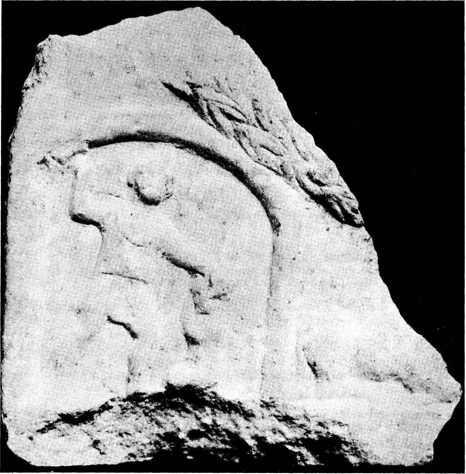
Sl. 8. Fragment mitraičke kultne slike iz Osijeka (broj 127)

je tijelo ležećeg bika, a nad njim su ostaci medaljona od stiliziranog lišća u kojem se nalazila središnja scena ubijanja bika. Ploča dakle sadržava prizor složenog tipa, koji pored središnjeg sadržava i druge prizore iz legende o Mithri. Radi se očito o Sarijinu podunavskom tipu kojem pripadaju i dvije kultne slike iz Siscije (br. 15 i 16). Na reljefu se naziru ostaci boje.