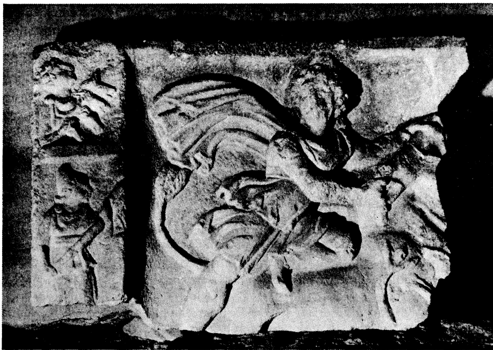
Sl. 5. Oštećena mitraička kultna slika iz III mitreja u Ptuju (broj 99)