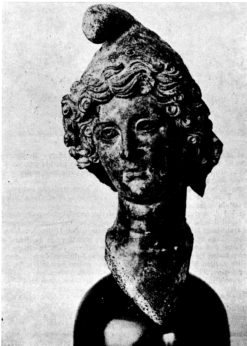
Sl. 2. Glava Mithre iz Siska (br. 17)

se prelijeva laki dah melankolije. Frigijska kapa ima svinut gornji kraj. Ukrašena je s tri vrpce ugraviranih ornamenata koji su prema Brunšmidu »nekad bili srebrom tauširani«. To su: gore ornament »vučjeg zuba«, u sredini cvijetni ornament, i dolje široka spirala. Vrat prelazi u zašiljeni dio prsiju,