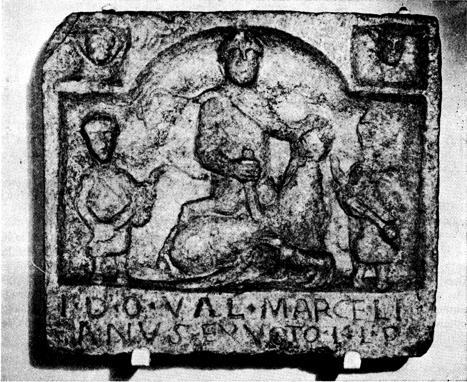
Sl. 6. Mitraička kulturna slika iz Pregrade, primitivne izradbe (broj 121)

Zavjetni reljef od mramora ( 0,435 \times 0,515 \times 0,07 ), nađen 1941. u vinogradu Donja Plamenščina kod Pregrade, sada u Arheološkom muzeju u Zagrebu (inv. br. 16). 172 U lukom označenoj špilji odvija se prizor tauroktonije: Mithra zaskače i ubija bika, pored rane su pas i zmija te škorpion, ovaj put ispred zmije. Nad lukom špilje je gavran, sa strana središnjeg prizora dva su