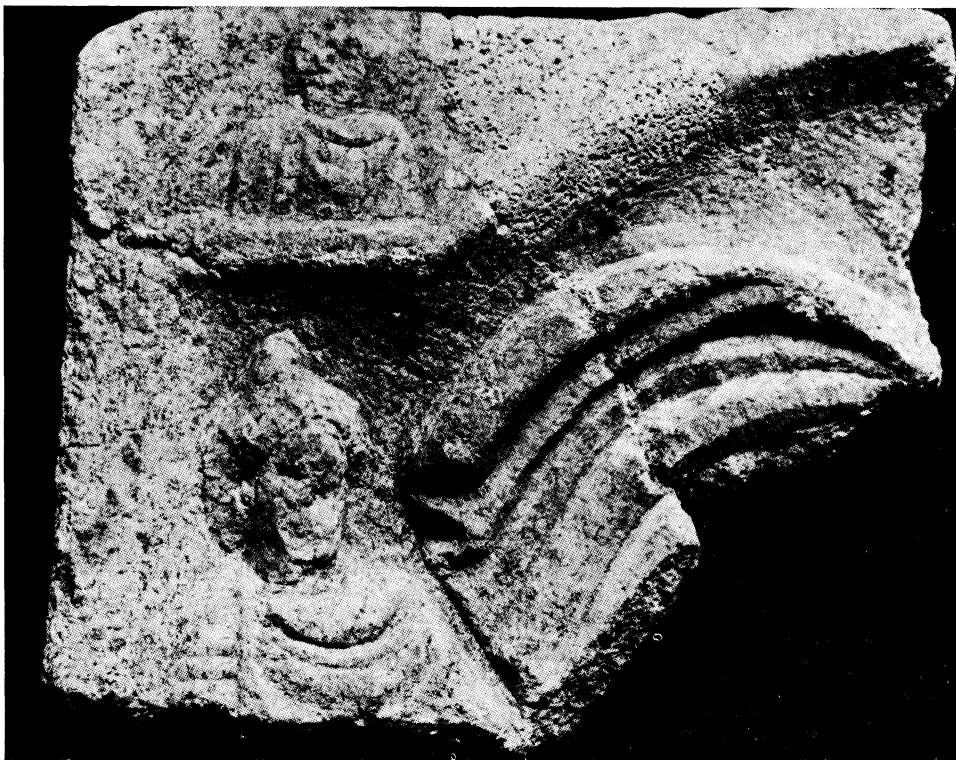
Sl. 7. Fragment mitraičke kultne slike iz Osijeka (broj 126)

(Cautopatesa) koji je obučen u običnu chlamidu i tuniku s dugim rukavima, dok na glavi nosi frigijsku kapu. U l. gornjem uglu plitka udubina u kojoj je smještena bista Sola, znatno oštećena. Odjeven je u nabranu chlamidu.