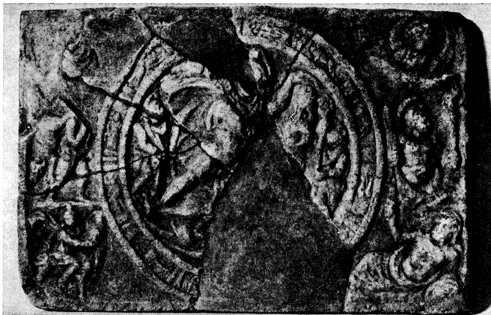
Sl. 1. Mithrina kulturna slika iz Siska (br. 16)

stao na stražnju njegovu nogu. Gubicu je životinje zadigao lijevom rukom, desnom joj zario bodež u vrat. Još je tu škorpion što napada genitalije bika, te očuvan stražnji dio zmijske. Lijevo Cautopates spuštene baklje, desno Cautes uzdignute. Noge im prekrížene.