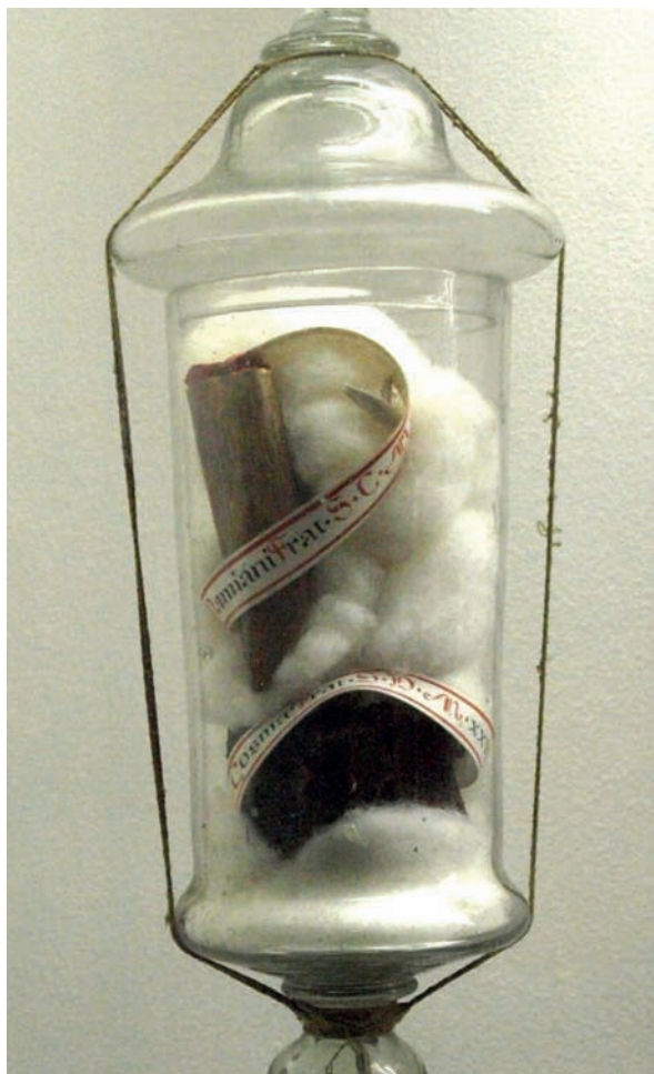
Slika 3. Relikvije sv. Kuzme i sv. Damjana u relikvijaru od murranskog stakla iz XVII. stoljeća.

Uvodno valja napomenuti da su pregled i anatomska prosudba relikvija u većem dijelu bili otežani, a katkad i nemogući iz više razloga. Ponajprije se to odnosi na relikvije koje se pripisuju određenim svecima koji su nabrojani u popisima uz nekoliko zbirki, a da pritom same relikvije nisu dodatno označene. Glede prosudbe sadržaja pojedinih re-