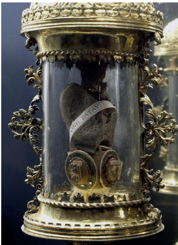
Slika 2. Pozlaćeni relikvijar iz XVI. stoljeća s relikvijama sv. Antona Padovanskog

Najviše, tj. 39 relikvijara osebujno je dizajnirano i izrađeno od muranskog stakla u XVI. i XVII. stoljeću. Drugu skupinu čine 33 metalna relikvijara (srebro, bronca, mjed i pozlata) u obliku križa, pikside ili pokaznice (slika 2). Nastali su u razdoblju od XV. do XIX. stoljeća. Karakteriziraju ih gravure i razni ukrasi te bogato dekorirani poklopci, nerijetko s križem ili likom sveca (4-6).