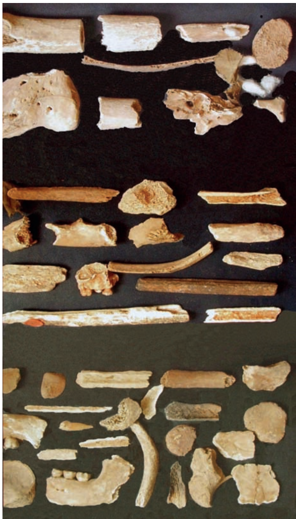
Slika 6. Dio koštanih ulomaka neidentificiranih svetaca izvan relikvijara.

i Kotora ili unutrašnjosti do Vukovara i Iloka. Sve one pobuđuju neskriven interes vjernika i teologa, a i šire javnosti. Istodobno pak začuđuje saznanje da, premda je to i svojevrsan antropološki izazov, u stručnoj, poglavito biomedicinskoj literaturi susrećemo razmjerno malo radova u kojima se relikvijama pristupa s tog motrišta, pa bi i to trebao biti dodatni poticaj za slična istraživanja.