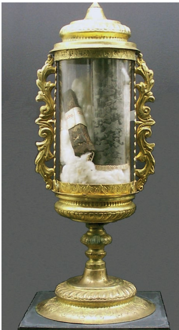
Slika 4. Pepeo koji je ostao od vatre i dio metalne šipke roštilja na kojem je mučen sv. Lovro u pozlaćenom relikvijaru iz XVI. stoljeća

Pritom valja podsjetiti da je registrirano i nekoliko slučajeva gdje se relikvije ovih svetaca samo spominju, ali nisu označene u nekoliko većih ili manjih zbirki.