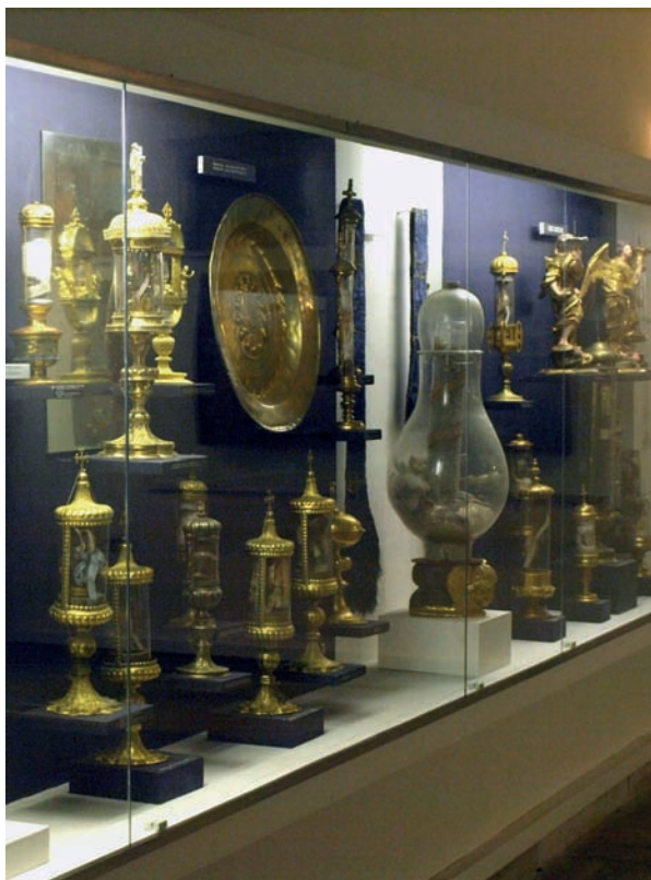
Slika 1. Dio relikvijara u vitrinama Zbirke sakralne umjetnosti u župnoj crkvi sv. Blaža u Vodnjanu.

Dugi niz godina relikvije su bile smještene u neprikladnim uvjetima, u zidnom ormaru u sakristiji, a sarkofazi s neras-