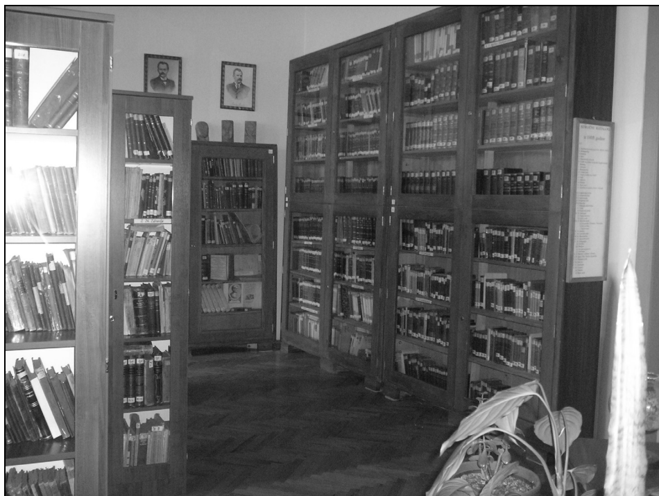
Sl. 1. Spomenička knjižnica

Školska knjižnica Srednje škole Pavla Rittera Vitezovića u Senju samo je jedan dio vrijedne kulturne baštine koju posjeduje grad Senj.