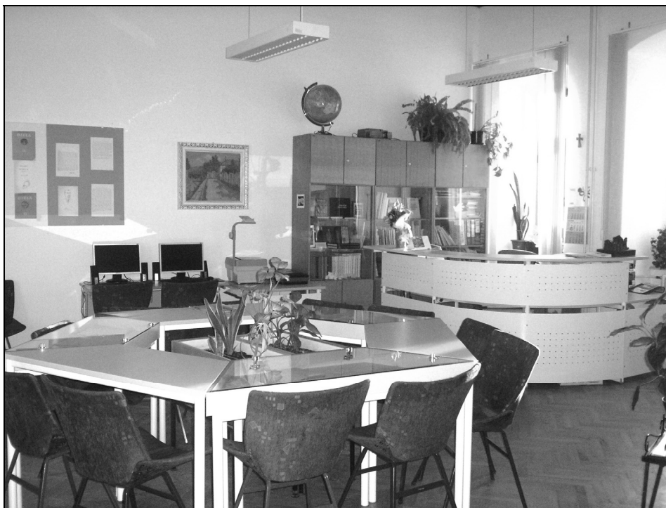
Sl. 6. Školska knjižnica danas: čitaonica i posudbeni odjel