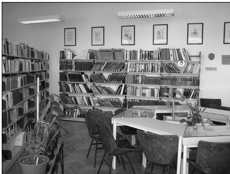
Sl. 5 Školska knjižnica danas, čitaonica