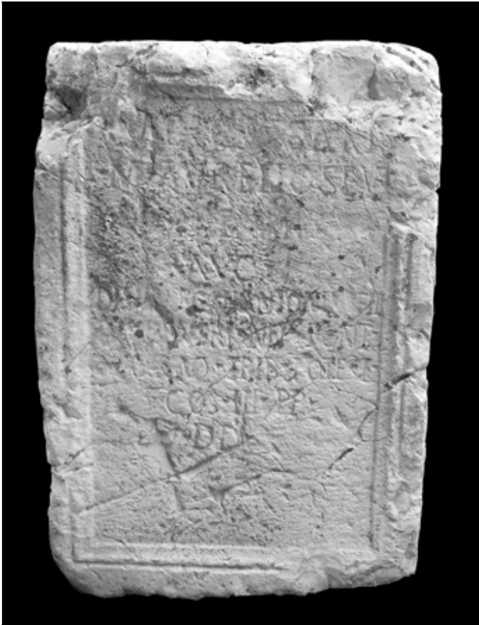
Sl. 3. CIL III, 3121 (10118) – natpis na bazi kipa cara Aleksandra Severa (Rab, lapidarij muzejske zbirke)