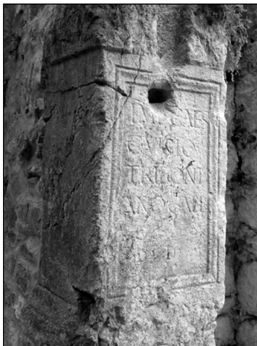
Sl. 4. CIL III, 3122 (10119) – natpis na bazi kipa cara Trebonijana Gala (Rab, kula Gagliardi)