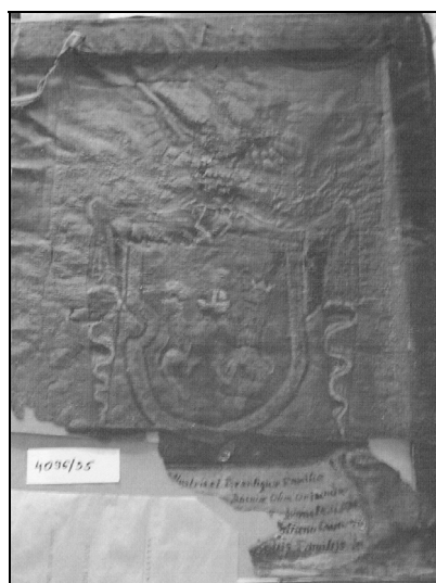
Sl. 1. Grbovi obitelji Domazetović (lijevo je dizajnirani grb izrađen na osnovi predloška iz grbovnika, desno je kopija originala, Gradski muzej Senj, inv. br: 4095, dolje je originalni grb, oštećen, Gradski muzej Senj, inv. br: 4096)