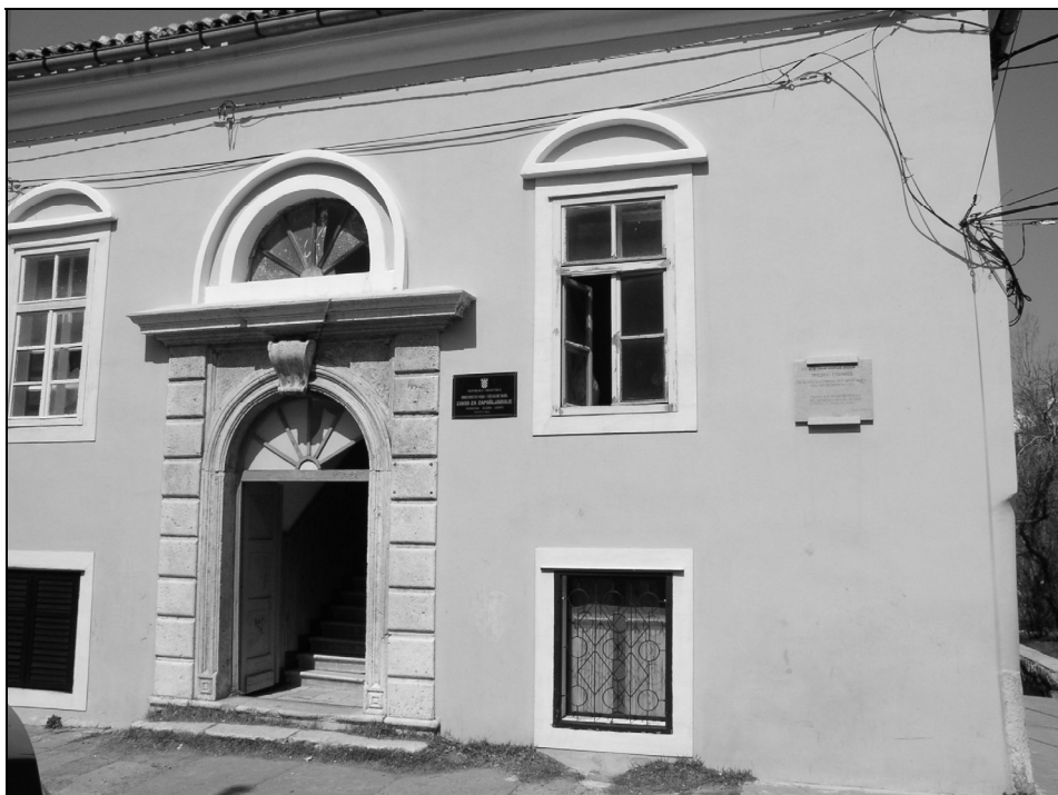
Sl. 6. Obiteljska kuća Domazetovića u Senju poznata pod imenom Ferajna

Juraj Domazetović je 1744. godine sagradio veliku raskošnu kuću u Senju na koju je postavio reljefni grb i natpis s tekstom koji pokazuje podrijetlo obitelji. 9