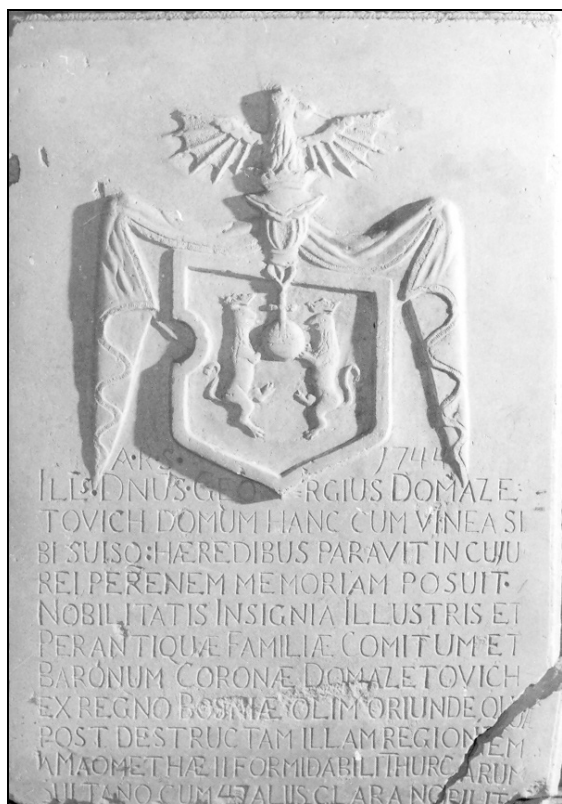
Sl. 5. Kameni grb Jurja Domazetovića s obiteljske kuće (danas se nalazi na tvrđavi Nehaj u Senju)

Obitelj Domazetović zajedno s poznatim senjskim plemićkim obiteljima Demelli i Vukasović 1759. godine pokreće postupak u Rimu protiv senjskog i modruškog biskupa Jurja Čolića, koji je zbog toga morao napustiti grad Senj, te je ubrzo i umro u Rimu, gdje je i pokopan.