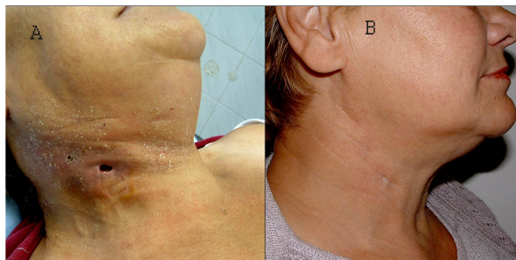
Slika 1. A. Stanje nakon incizije apscesa na vratu; B. Kompletno izlječenje 10 mjeseci poslije Picture 1. A. Patient neck after incision of neck abscess; B. Complete resolution ten months later

Nakon dva tjedna kontrolni CT pokazuje desno ispod donje čeljusti stanje iza incizije kože s upalno promijenjenim mekotkivnim strukturama (Slika 2.). Ispod i iza podčeljusne žlijezde nalazi se zrakom ispunjen prostor, koji se prati do otvora na koži. Desni sternokleidomastoidni mišić je dvostruko uvećan u odnosu na lijevi, voluminoznija je i podčeljusna žlijezda.