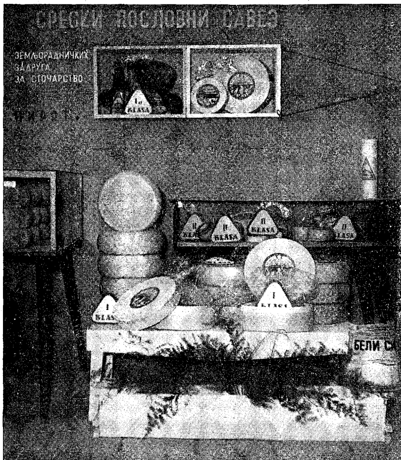
Sl. 1. Mliječni proizvodi iz NR Srbije (Sreski poslovni savez Piroć)