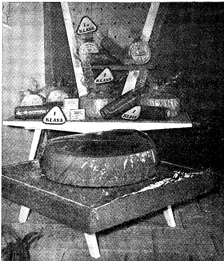
Sl. 2. Mliječni proizvodi iz NR Hrvatske («Slavonka» Sl. Požega)

Ocjenjivanje je održano u Centralnoj mlekari Novi Sad, koja je u svojim hladnjačama pružila neophodno potreban prostor za čuvanje mliječnih proizvoda do rada ocjenjivačke komisije i do same izložbe. Za ocjenjivanje prihvaćen je sistem od 20 točaka i razvrstavanje u kvalitetne skupine: