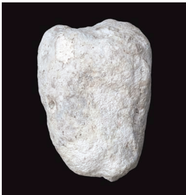
Slika 3 Ženski portret (lijevi profil)

jena prema straga gdje su se mase kose križale i ispreplele i savile u kolut po sredini glave. Glava je lagano nagnuta na lijevu stranu (prema ramenu koje nije očuvano). Sačuvan je samo početak vrata. Stražnja je strana glave dosta