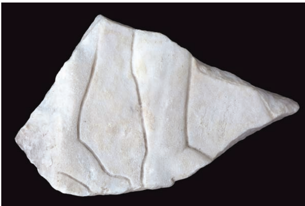
Slika 1 Fragment atičkoga sarkofaga

još jedna, nešto plića svrdlana linija zavijena oblika. S obzirom na nedostatnost očuvanoga dijela teško je reći što je tu bilo prikazano, ali najvjerojatnije pripada završetku viseće hlamide susjedne, nedostajuće figure.