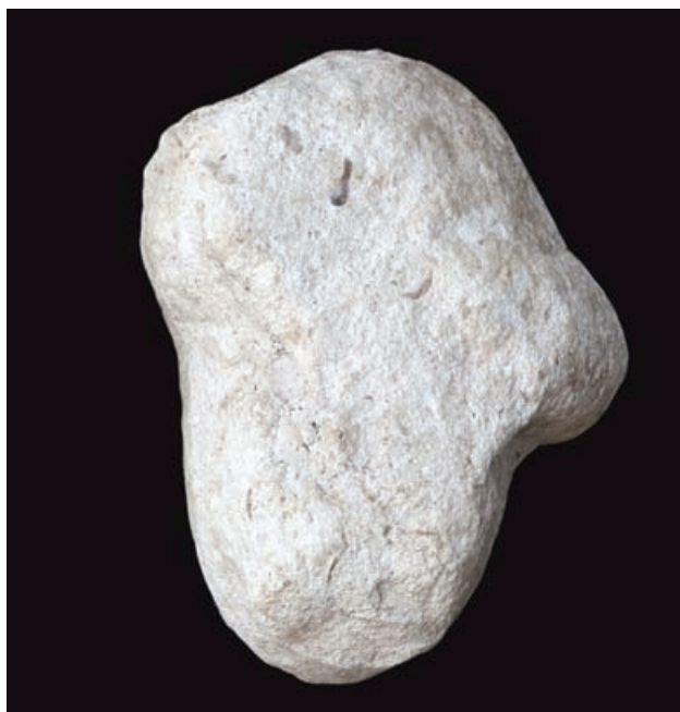
Slika 5 Ženski portret (otraga)