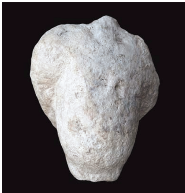
Slika 2 Ženski portret (pravo)

jena prema straga gdje su se mase kose križale i ispreplele i savile u kolut po sredini glave. Glava je lagano nagnuta na lijevu stranu (prema ramenu koje nije očuvano). Sačuvan je samo početak vrata. Stražnja je strana glave dosta