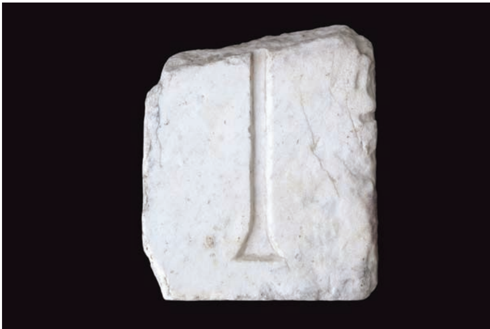
Slika 7 Fragment križa (snimio Jakov Teklić, 2010.)

su oni oltarne pregrade veći i robustniji. Križevi su obično neduboko uparani, poput uskoga žlijeba, u prednju stranu površine spomenika. Ima i križeva koji imaju trokutasti žlijeb koji je, iako jednostavan, složeniji po svome klesarskom postupku jer se prije svega udubljuje žlijeb, a zatim se strane ureza koso priklesavaju. Postoji, međutim, i pravokutni, razmjerno široki žlijeb koji se dobija snižavanjem površine dlijetom sa širokim vrhom. Svi križevi iz Salone, a i iz Dalmacije koji slijede salonitansku klesarsku praksu, imaju trokutasto proširene krajeve svih krakova te veoma često i »oko« na spoju verikalnoga i dvaju horizontalnih krakova. Njihov kratki vodoravni krak posljedica je nedovoljnoga prostora jer su stupići uski. Primjerci sa širokim žlijebom su po svoj prilici imali umetnuti uložak od metala, najvjerojatnije od bronce, koji je davao koloristički efekt, odnosno veću dekorativnost kršćanskoga simbola. Metalni uložak morao je točno odgovarati žlijebu tako da paše i sigurno stoji u rupi, bez zakivanja za pozadinu. 28