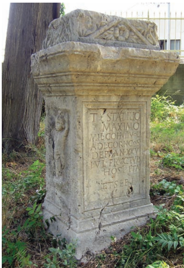
Slika 2 Prednja i lijeva bočna strana Maksimove are

Posebice vrijedi napomenuti da je stražnja strana cijelom visinom spomenika samo abocirana grubim potezima šiljastoga dlijeta i zatim zaravnana zubačom, zbog čega je sa sigurnošću moguće zaključiti da je izvedba polja i profila opisanih prethodno završavala na spoju bočnih i stražnje strane (sl. 5). To sasvim sigurno stoji u vezi s postavljanjem spomenika na nekropoli, tj. s činjenicom da je ara sigurno bila prislonjena uz zid ili neku drugu sličnu strukturu, zbog čega izrada dekoracije na stražnjoj strani nije niti bila potrebna. Od sitnijih detalja još valja