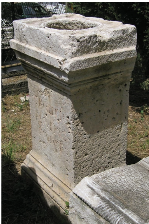
Slika 7 Salonitanska ara T. Publicija Asklepija

Salonitanska ara Tita Publicija Asklepija, kao i mnoge druge u Saloni, bila je u kasnoj antici reciklirana kao građevni materijal, i to u jednoj od kula zapadnoga proširenja grada, odakle je izvađena godine 1881. 33 Dimenzijama je tek nešto malo manja od Maksimove are (sl. 7). Visina joj je 1,19 m, širina 0,59 m, a debljina 0,44 m. Također je monolitne izrade sa sličnim rasporedom profila koji odvajaju bazu, trup i krunište. Ispod trupa se redom nižu plinta, poluboli profil ( torus ) i obrnuti cyma recta profil bez dekoracije. Trup je jednostavne izrade bez pripadajućih profila koji obrubljuju plohe kvadera, pa tako i prednju s natpisom. 34 Krunište raščlanjuju cyma reversa , uska fascija, cyma recta s visokim gornjim rubom i nešto uži četvrtasti vršni dio. Vršni je dio nalik onome s Maksimove are, ali uz razliku da nema dekoracije ni na prednjoj ni na bočnim stranama. Na njegovoj gornjoj plohi udubljen je recipijent kružna oblika, promjera 28 i dubine 24 cm (sl. 8). Rub recipijenta plastično je izdignut u odnosu na ravnu plohu oko njega, odnosno u istoj je visini s rubovima koji funkcioniraju kao okviri, širi na bočnim i uži na prednjoj i stražnjoj strani. Bočni su okviri prekinuti na dva mjesta širokim kanalima, za koje je evidentno da su primali jake metalne spojnice (klamfe) kojima je učvršćivan poklopac koji je zatvarao recipijent. Unutrašnjost recipijenta obrađena je potezima šiljastog dljetja, možda tek malo pravilnije izvedbe negoli na Maksimovoj ari.