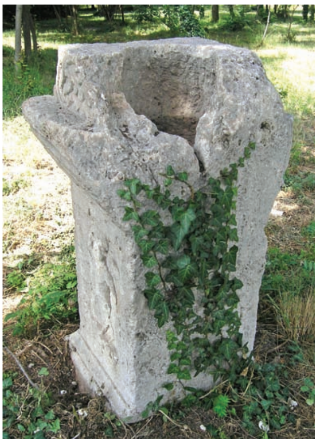
Slika 5 Stražnja strana Maksimove are

Pretpostavimo li da je recipijent s Maksimove are nastao kao rezultat preradbe, tj. za potrebe njezine sekundarne funkcije, ne ostaje mnogo mogućnosti po pitanju kakvu je funkciju u tom slučaju recipijent mogao imati. On bi imao smisla jedino pri okomitom postavljanju spomenika, dakle kao i u izvornom ili današnjem kontekstu, jer bi jedino u tom položaju mogao nesmetano primiti neki sadržaj, npr. služiti kao mali bazen za vodu, škropionica ili nešto slično. Međutim, malo je vjerojatno da bi u tom slučaju na prednjoj strani bio ostavljen netaknut natpis. Osim toga, kanal prokopan od dna recipijenta prema stražnjoj strani spomenika u direktnoj je oprjeci s takvom pretpostavkom. Njegova izrada prije se može shva-