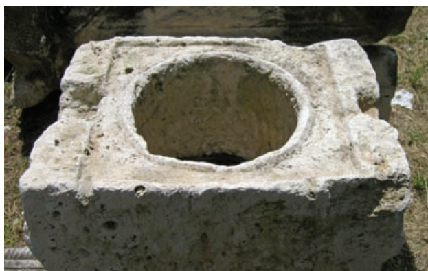
Slika 8 Vršni dio kruništa Asklepijeve are s izdubljenim recipijentom