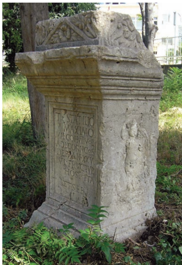
Slika 3 Prednja i desna bočna strana Maksimove are