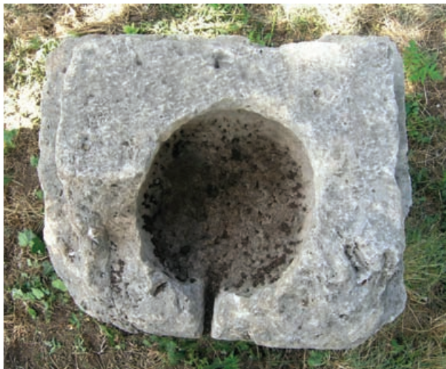
Slika 4 Vršni dio kruništa Maksimove are s izdubljenim recipijentom

zabilježiti pojavu manjega četvrtastog utora na srednjem profilu baze lijeve bočne strane, koji nema pandan na desnoj strani.