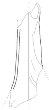
Slika 3 Ulomak spaljenoga balsamarija, kat. br. 4