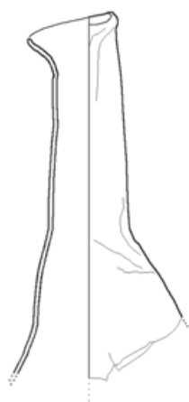
Slika 2 Ulomak spaljenoga balsamarija, kat. br. 3