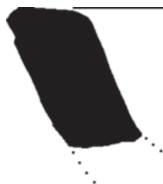
Slika 8 Dio kamene posude