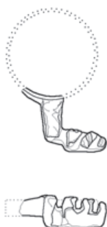
Slika 5 Prsten-ključ, kat. br. 6