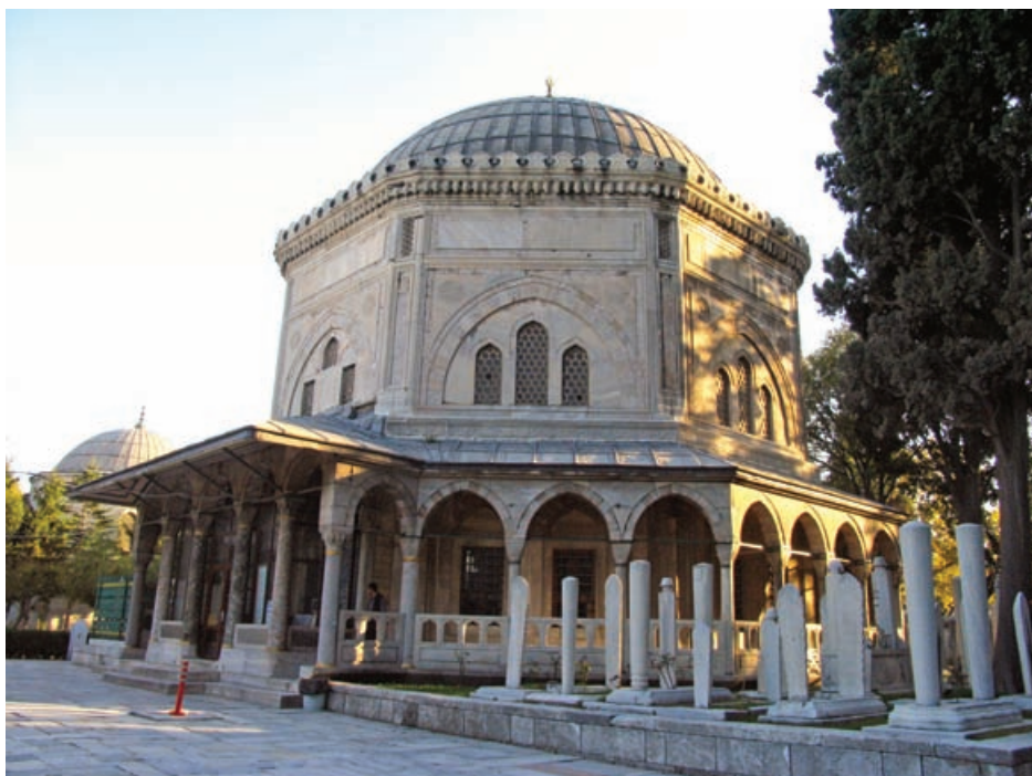
Slika 3 Istanbul, Sulejmanova džamija - Mauzolej (Turbe) Sulejmana Veličanstvenoga i Mihrimah

otac Sulejman Veličanstveni bio joj je privržen, a suvremeni spominju da je često uza nj jahala na njegovim vojnim pohodima i obilascima velikoga Carstva. Bila je s njim u bitci kod Gizabara u sjevernom Egiptu gdje je jahala na Batalu, svom omiljenom pastuhu. Ocu je obećala 400 galija koje će opremiti o svome trošku ukoliko se sultan odluči na potpuno uništenje vitezova ivanovaca na Malti (Malteški vitezovi). Na njih je bila izuzetno ljuta, posebice nakon što su vitezovi počeli zaustavljati muslimanske hodočasnike koji su brodovima krenuli na hidžru, u Meku. Nakon što je opljačkan jedan od trgovačkih brodova koji je vozio robu za harem u Carigradu a plijen odnesen na Maltu, princeza je pobjesnila. Međutim obećanje nije održala! Pred Maltom se u svibnju 1565. pojavilo oko 200 turskih brodova. Opsada je trajala do rujna kada su se posramljeni ostaci turske vojske morali povući. 13