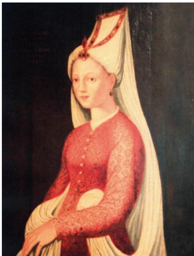
Slika 1 Portret princeze Mihrimah (Mazovian museum, Plock, Poljska)

čare. 5 Porez se naplaćuje na sve i sve je na prodaju pa tako i brojne državne službe i dužnosti. Rustem-paša u širokim narodnim masama postaje vrlo nepopularan pa ubrzo dobiva i nadimak Uš ili Ušljivac! 6 Zapadnoeuropski poslanici u Carigradu, Flamanac Busbecq i mletački bailo (poslanik) Bernardo Navagero, ističu njegovu snalažljivost, okrutnost, ali i jako dobro pamćenje te spremnost da za novac napravi sve. 7 Zli su jezici opisivali kako je iz carskoga vrta prodavao ruže i ljiljane, a sluge je tjerao da opremu i oružje ratnih zarobljenika uredeno slažu i popisuju kako bi i to lakše i brže prodali. Mržnji prema veziru pridonijelo je i stalno spletkarenje na vladarskom dvoru gdje su se veliki vezir, princeza Mihrimah i sultanija Rokselana neprestano trudili pridobiti Sulejmana na svoju stranu i okrenuti ga protiv sinova iz ranijih brakova, posebice najstarijega, Mustafe.