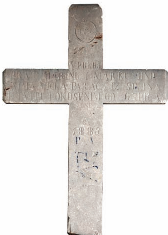
Slika 20 Nadgrobni križ s natpisom Marina i Marka Paraća, prednja strana