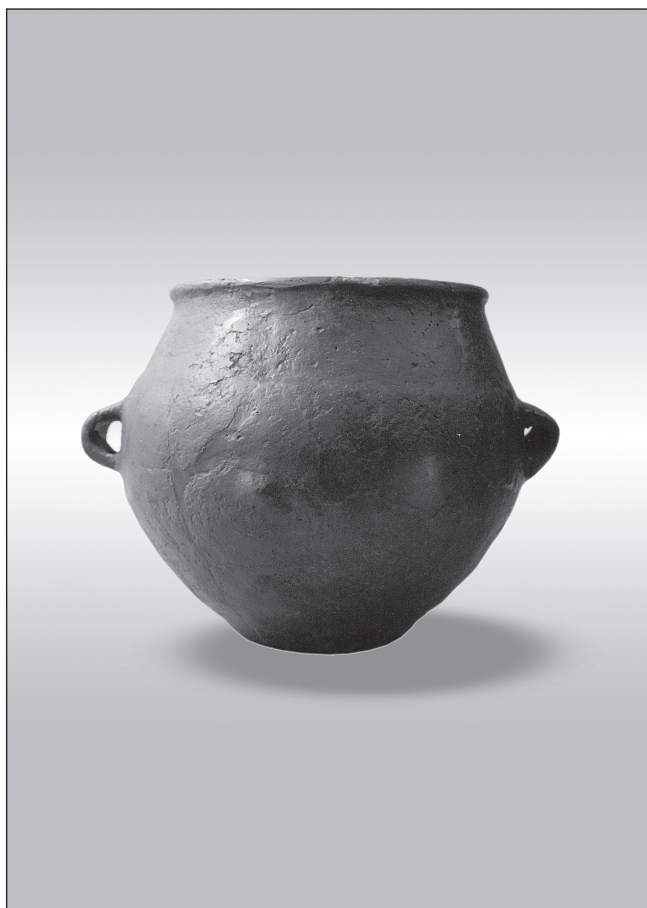
Sl. 2 Žara iz Lepoglave Fig. 2 Urn from Lepoglava

svom gornjem dijelu možda i zemljom od iskopa na što bi ukazivala sterilna zemlja nađena u žari prilikom analize sadržaja. Drugih priloga u ovom grobu nije bilo.