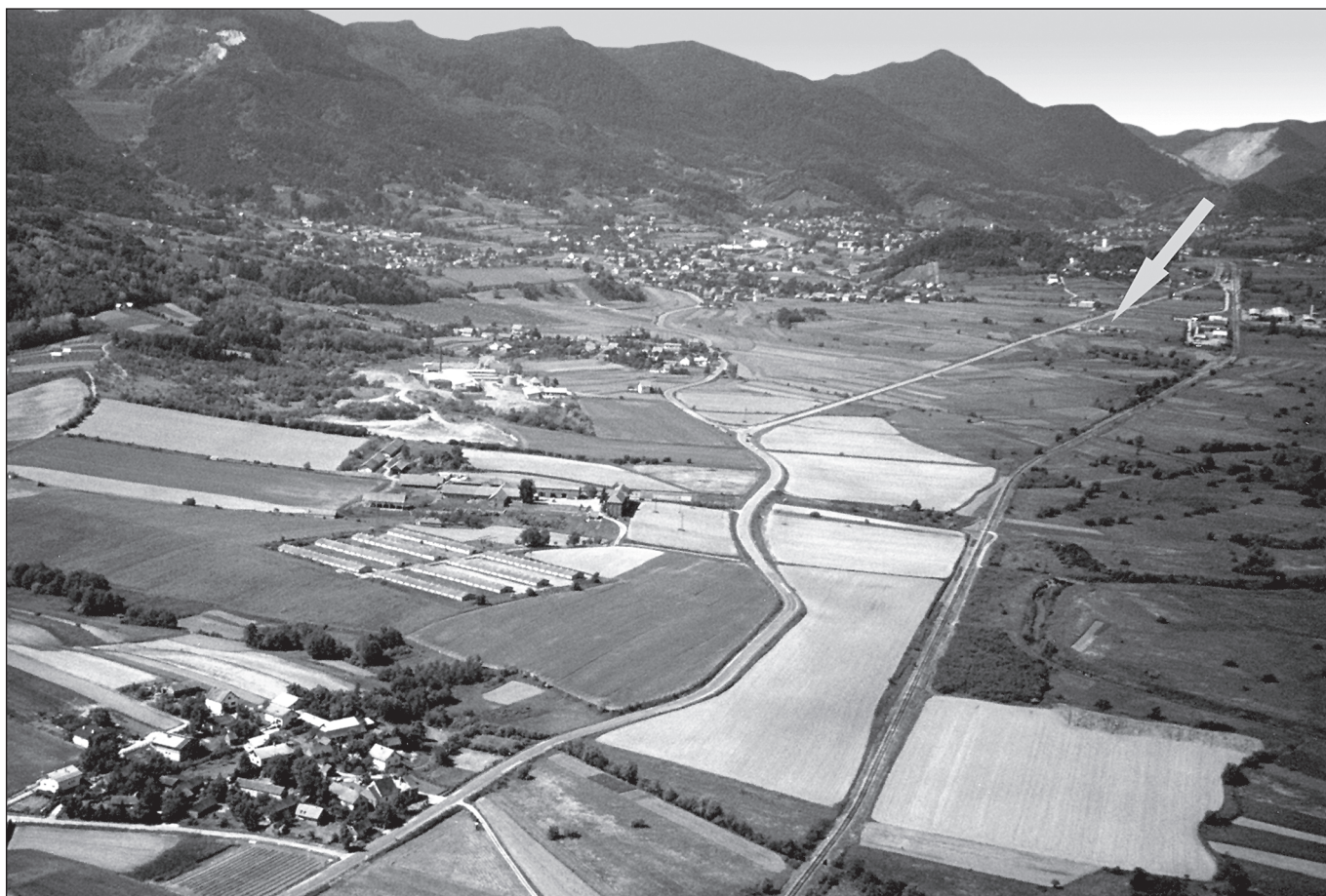
Sl. 1 Lepoglavska kotlina, u pozadini brdo Gorica i označeno mjesto nalaza groba