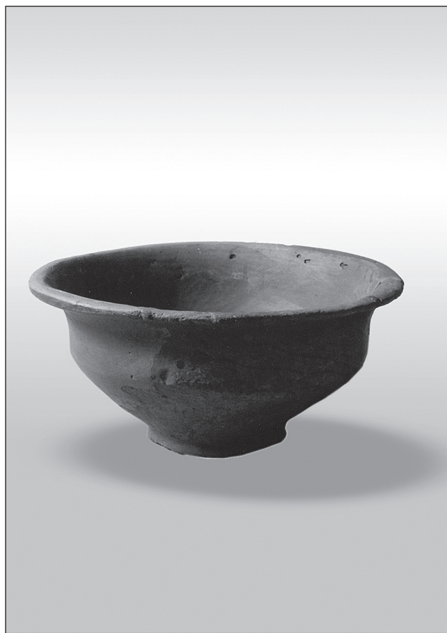
Sl. 3 Zdjela iz žarnog groba Fig. 3 Bowl from the urn grave

Karakteristike grobnog rituala i tipološke osobitosti keramike opredjeljuju žarni grob iz Lepoglave u kasno brončano doba i to u I. fazu kulture polja sa žarama