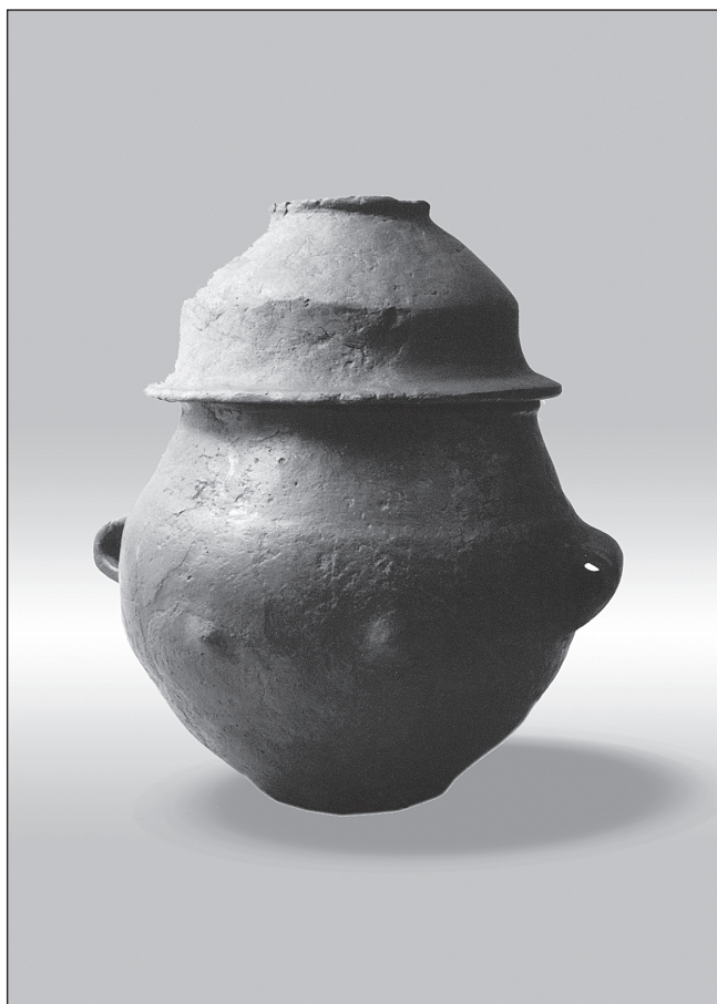
Sl. 4 Rekonstrukcija položaja žare i zdjele Fig. 4 Reconstruction of position of the bowl and the urn

Na temelju općih karakteristika grobnih posuda iz Lepoglave, ali i načina ukopa možemo naš grob svrstati među nekropole najranije faze kulture polja sa žarama, odnosno njezine grupe Virovitica. Uspoređujući žaru iz Lepoglave sa sličnim nalazima na prostoru sjeverozapadne Hrvatske, srodnosti u profilaciji nalazimo u grobovima 2, 6 i 11 iz Drljanovca (Majnarić-Pandžić 1988: T.I:1; T. IV:1; ISTA 1994, T.I: 2) uz opasku da naša urna ima dvije trakaste ručke za razliku od žara iz Drljanovca kod kojih se u pravilu javljaju jezičaste ručke. Upravo slične, iako ne iste ručke približavaju naš nalaz primjercima iz nekropole u Virovitici, osobito žari iz groba 1 i groba 2 te posudama iz uništenih grobova (Vinski-Gasparini 1973: T.7:2; T. 8:1; T.11:2,3). Uz izrazite sličnost koje postoje i s nalazima iz groblja u Moravču (npr. Sokol 1996: sl.8,3 ; sl.12, 2 ), kod nekih oblikovnih detalja uočavaju se i određene razlike. Ovo se prije svega odnosi na modeliranje širokih bradavičastih ispupčenja, koja su na nekim posudama iz Moravča okružena plitkim žlijebom (Isti 1996: sl.5, 2; sl.12, 2) što na našoj žari nije slučaj.