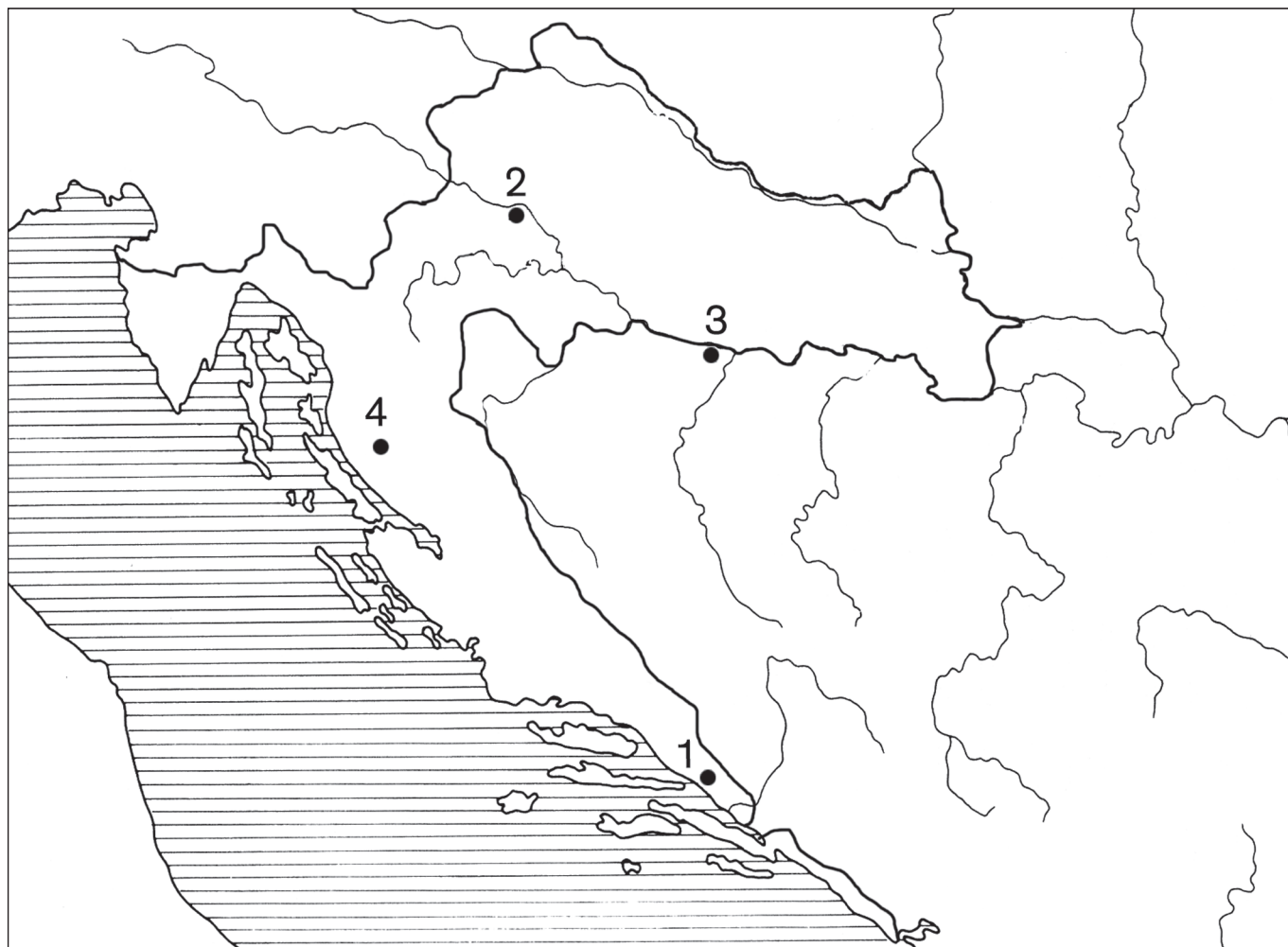
Sl. 2 Karta rasprostranjenosti ornamentiranih kasnobrončanodobnih koplja kulture polja sa žarama na prostoru Hrvatske: 1. Podaca, 2. Velika Gorica, 3. Donja Dolina, 4. Prozor

konkretnije Ha B1 (1000.-900. g. pr. Kr.), ponajprije na temelju utvrđene datacije nalaza iz groba 1/1911 nekropole iz Velike Gorice. Nadalje, u slučaju ovog vrijednog nalaza koplja iz Podace, uostalom kao i primjeraka iz Donje Doline i Prozora, inače prostorno znatno bližim matičnoj manifestaciji grupe Velika Gorica kulture žarnih polja, opravdano je govoriti kao o luksuznijim predmetima nabavljenim kupnjom, razmjenom ili poklonom. Njihovo prispijeće upravo s prostora sjeverozapadne Hrvatske upućuje i na samo teritorijalno središte izrade ovih koplja. U tom pogledu zamjetna je istorodna stilska provedba u ukrašavanju motivima girlandi, šiljatih lukova i horizontalnih linija, tako dosljedno zastupljenih na velikogoričkom koplju i okovu, naročito kompozicijski slično organiziranim na koplju iz Podace. Prijedlog za radioničku izradu ovih koplja na prostoru sjeverozapadne Hrvatske iznijet je akcentom na odabir i provedbu ornamentalnih karakteristika razmatranih koplja. Temelji se na izgledu prethodnih objava ornamentiranih koplja sa šireg prostora Europe, sjeverozapadno od područja rasprostiranja kulture polja sa žarama. Primjerice, na prostoru jugozapadne Njemačke u dati Ha B1 stupanj opredijeljena su koplja koja s ovdje razmatranim