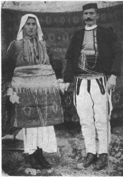
Mijačka nošnja: Žena i muž.