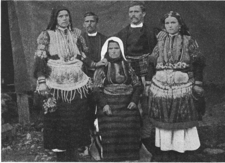
Mijačka nošnja. Porodica.

turčen i zovu ih Torbeši ili Kurki. Kurki su sačuvali jezik i do danas. Arnauti i Turci nisu ih mnogo marili, pa su i oni bili raja, kao i ostali hrišćani. Zbog pritiska Arnauta iz Albanije i oni su se morali seliti. Ima puno njihovih novih naselja na Babuni planini, oko Velesa i Skoplja. I tamo ih zovu Torbeši. Istoriju turčenja nisam mogao tačno utvrditi. Čini se, da ih je poturčio Sinan Paša iz Prizrena. Kao da je to neki janičar poreklom iz Gore Prizrenske, pa je iz zahvalnosti, što je spoznao pravu veru Alahovu i postao paša, poturčio i Prizrensku Goru, i jedan deo Mijaka i Poljana kod Debra. To turčenje kao da je bilo na kraju XVIII. stoleća.