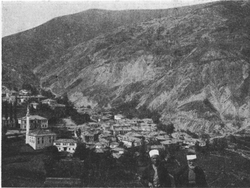
Selo Žernonica (muslimansko, torbeško, t. j. poturčenjačko selo; spreda 2 hodže, učitelji u tom selu iz porodice Popović).

Isprva su Mijaci bili jako ratničko pleme. Živeli su na visijama i zanimali se stočarstvom, ili su stoku plenili od Kucovlaha. To nam svedoče i mnoge narodne pesme i predanja. Poznata je pesma o Čelnik Peji: »Zacvilela mi ovca roguša, na vrh planine, na sred ramnina«. Ta je ovca cvilela za svojim gospodarom, ko ga su ubili, ogromno mu stado razgrabili, a ovčare poubijali. Mijaci su se tada protezali na mnogo većem prostoru no sada, ali uvek po visijama. Ima tragova da su stanovali na planini Jablanici, kod Elbasana, prema Golom Brdu u Bulčici. Kao dokaz mogu da nam posluže ovi primeri: