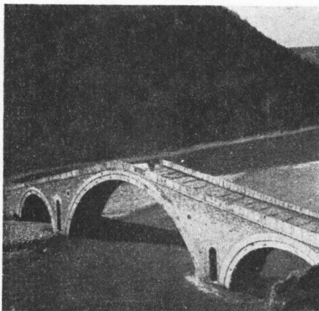
Gorenčki most i granica između Mijaka i Debarskog Polja i Kadžadžika.

u selu sazivan je pomoću v i k a č a, koji je sazivao selo vičući sa najvišeg mesta: »Slušajte selani! Utre će se bereme sred selo. Koj ne će dojet imat kazna, a o—o—o!« Na zboru se je sedelo u krugu, a u sredini kruga bio je glavari. Ovaj način rešavanja seoskih pitanja zadržao se je bio do obrazovanja opštinskih sudova po oslobođenju 1912. godine.