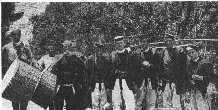
Topani (muzika) u Mijaka.

drugi dokazuju, da su ljudi iz ovoga sela bili tako opasni, da se je okolina »tresla od straha«, pa otuda i ime. Uostalom ime Tresino, Tresonica, poznato je, i nose ga baš sela.