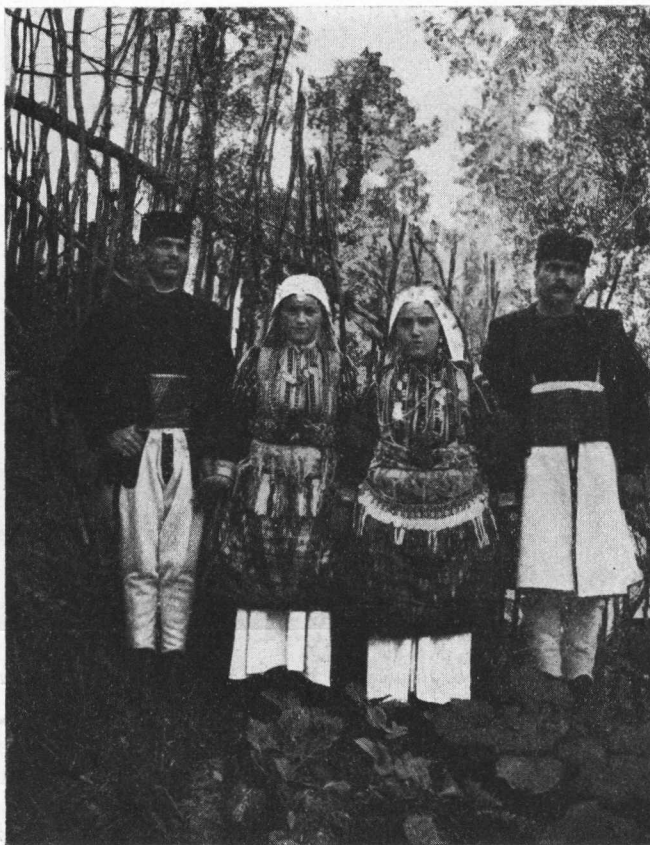
Narodna nošnja Mijaka iz sela Lazaropolja.

je bio tako neustrašiv, da su drhtali pred njim. Mnoge je bacao s prozora na dvorište. Za svet se je interesovao sve do svoje velike starosti (rođen oko 1780., a umro 1888. g.) Za vreme stvaranja egzarihije bio je istaknut borac, jer je mislio, da se bori za slavenstvo i za Rusiju. Kada je doznao da je napravljena željeznica Skoplje—Solun, on kao pomlađen, seda na osedlanog konja i odlazi u Skoplje da vidi to čudo koje samo ide. Onda je prisutnim svojim seljanima rekao: »Beše mu staro vreme! Od sada ne- mojte više da me slušate, idite u svet i učite se po knjigama«.