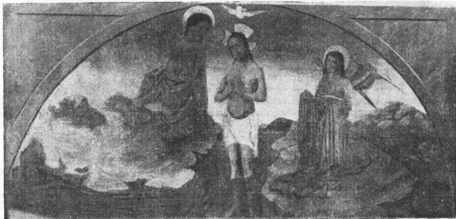
Krštenje Hristovo, domaći rad (ili Nikole Božidarevića, ili Miha Kamzića). U Dubrovačkom arhivu.

liko je moguće, radi tijesna prostora uređuje. To uređivanje sporo napreduje, jer Gelčić te spise većinom od manje vrijednosti nije bio ni numerirao, već ih jedino skupio na sekcije (sekcija XXXXI—LXXV). Kođod zaviri u arhiv, na prvi mah opaža, da su današnje arhivske prostorije nedovoljne i da je od prijeke potrebe potražiti za arhiv veće prostorije, naročito, kad se još prenese iz Beograda ono 1800 isprava i smjesti na svoje staro mjesto. Suvise bi bilo uputno, kad se nađu veće prostorije, da se prenesu u arhiv i oni spisi novijega vremena, što se sada nalaze u oficirskom domu u Dubrovniku. Rodoljubna bi dužnost bila i privatnika, koji još imaju spisa i kodeksa iz doba republike, da ih dadu na pohranu u arhiv.